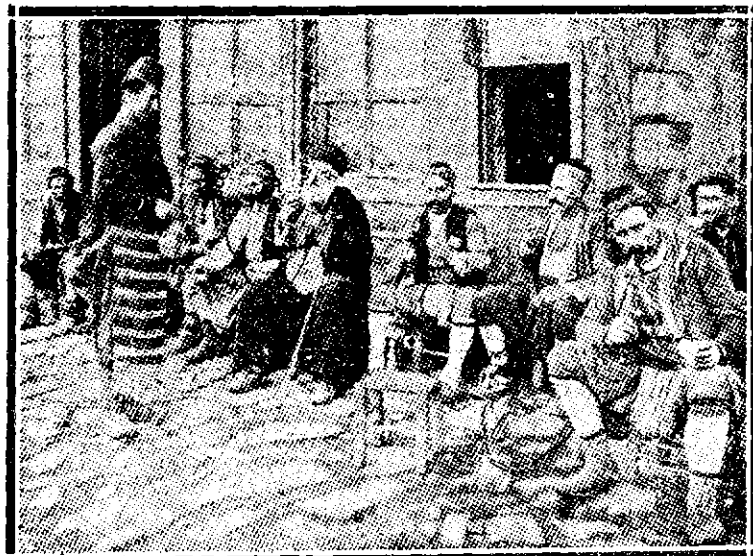
O cafenea populară turcească