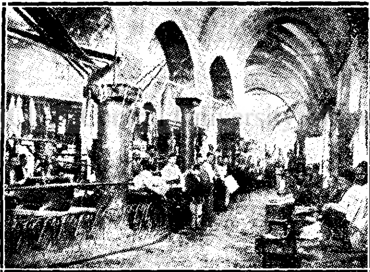
Marele bazar din Stambul