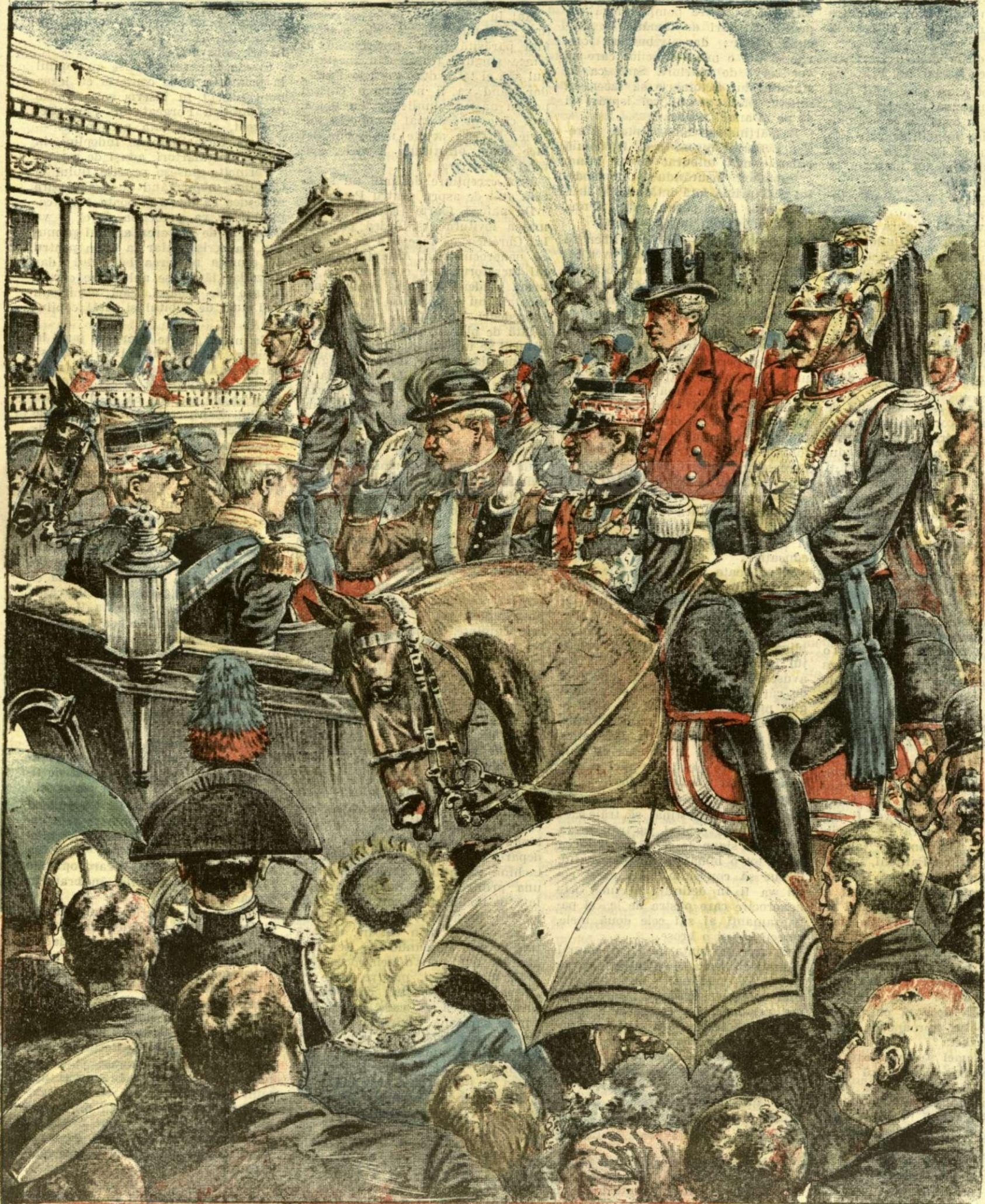
A. S. R. PRINȚUL CAROL LA ROMA

ANUNCIURI Linia pe pagina 7 și 8 —BANI 20—