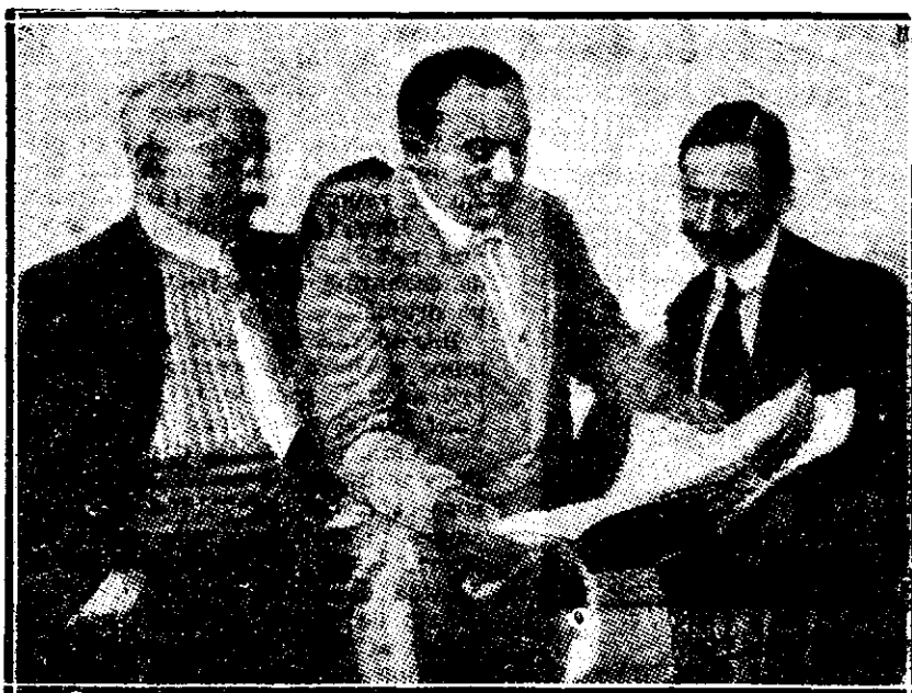
Tenorul Caruso la studiul unei partituri.