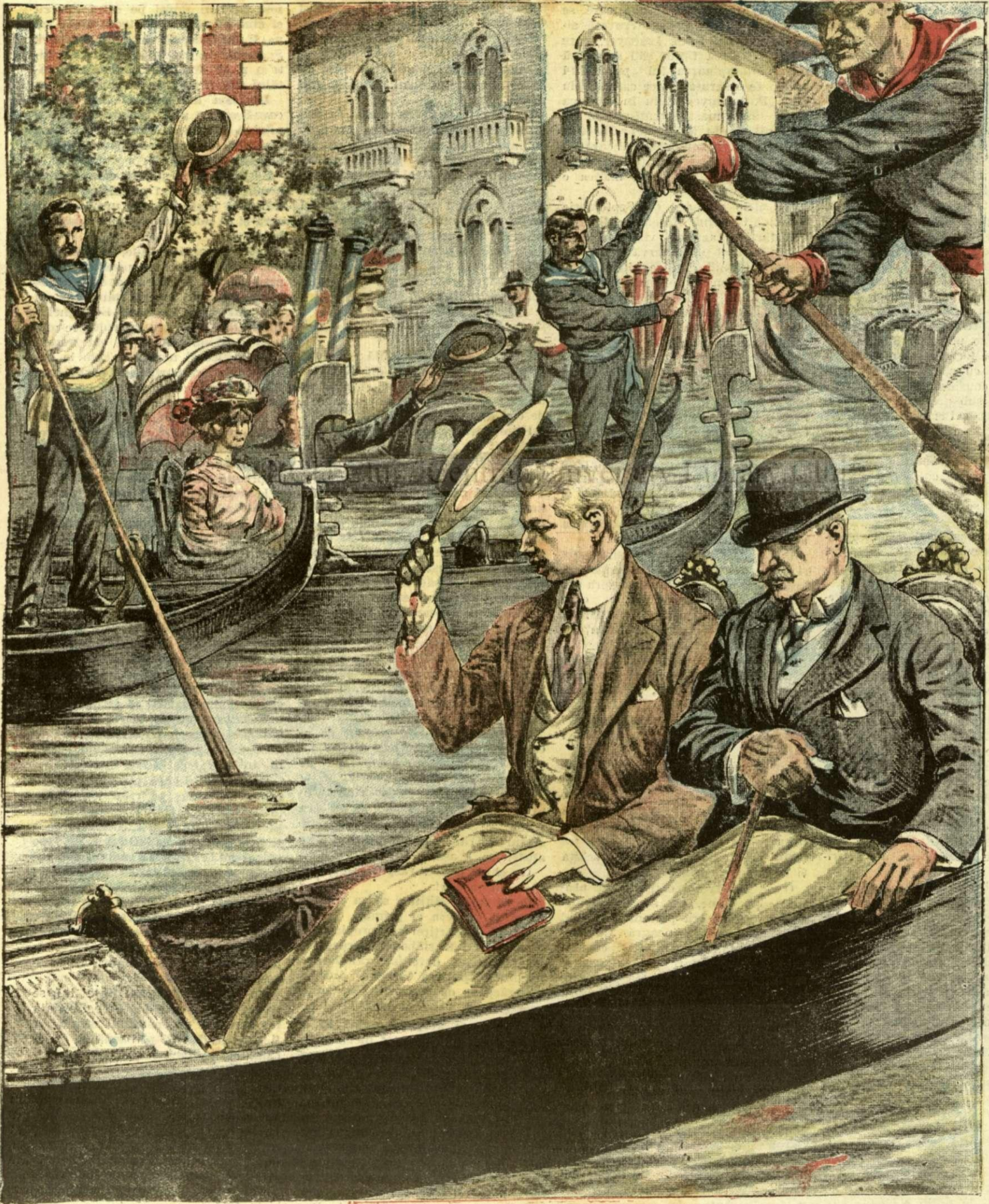
Pimbarea Prințului Carol în gondolă, la Venetia.

ANUNCIURI Linia pe pagina 7 și 8 — BANI 20 —