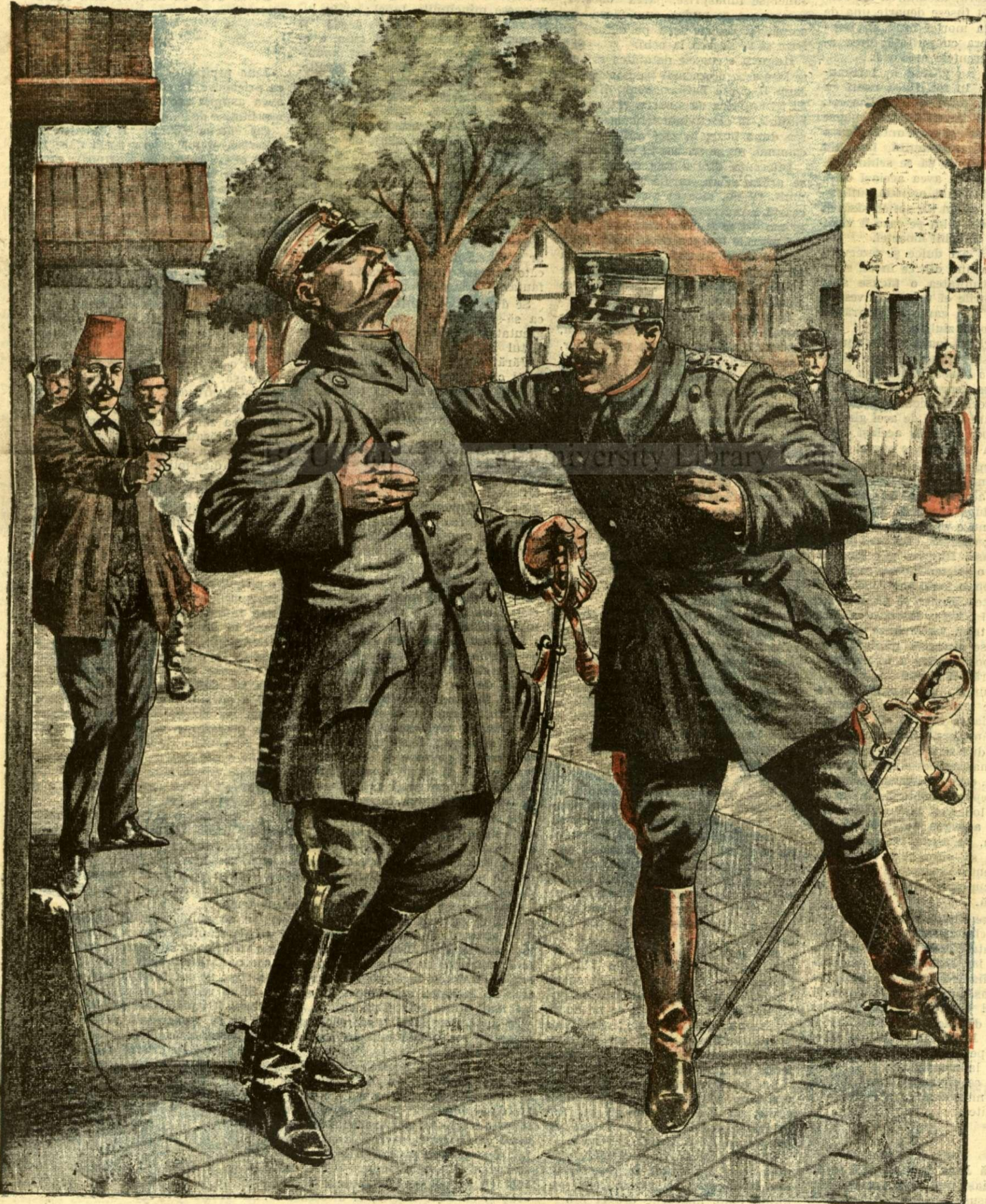
ASASINAREA REGELUI GEORGE AL GRECIEI