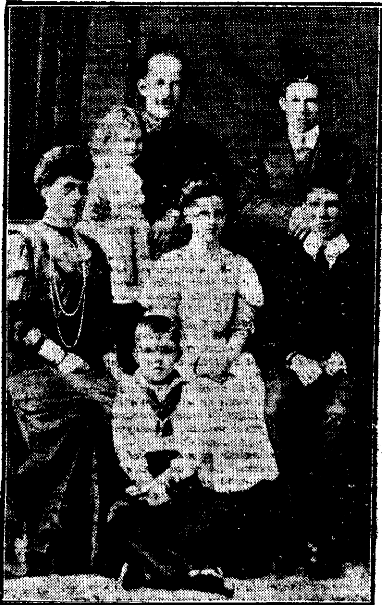
Noul rege al Greciei și familia sa