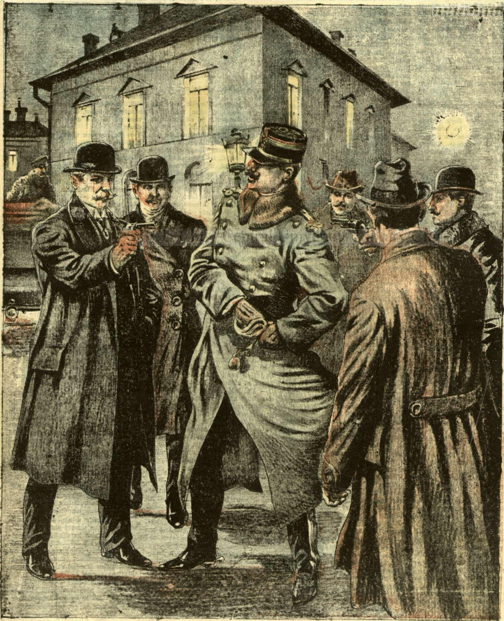
ARESTAREA UNUI TRADĂTOR

ANUNCIURI Linia pe pagina 7 și 8 — BANI 20 —