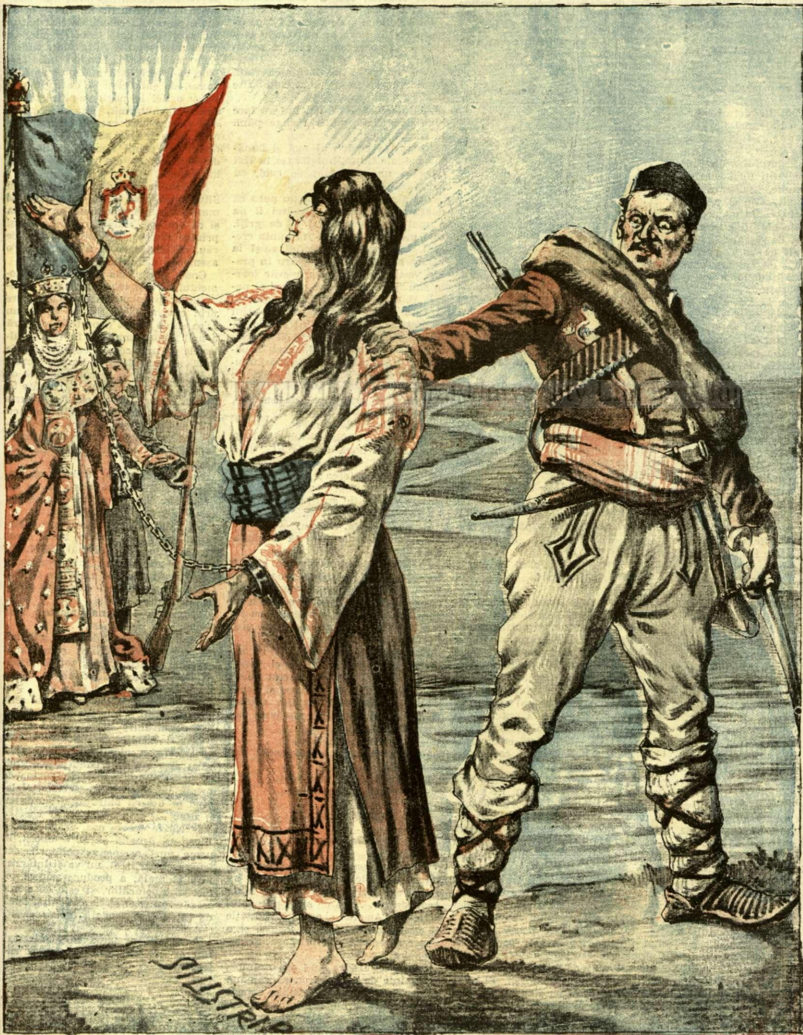
DRISTORUL NOSTRU. — (Vezi explicația)

ANUNCIURI Linia pe pagina 7 și 8 — BANI 20 —