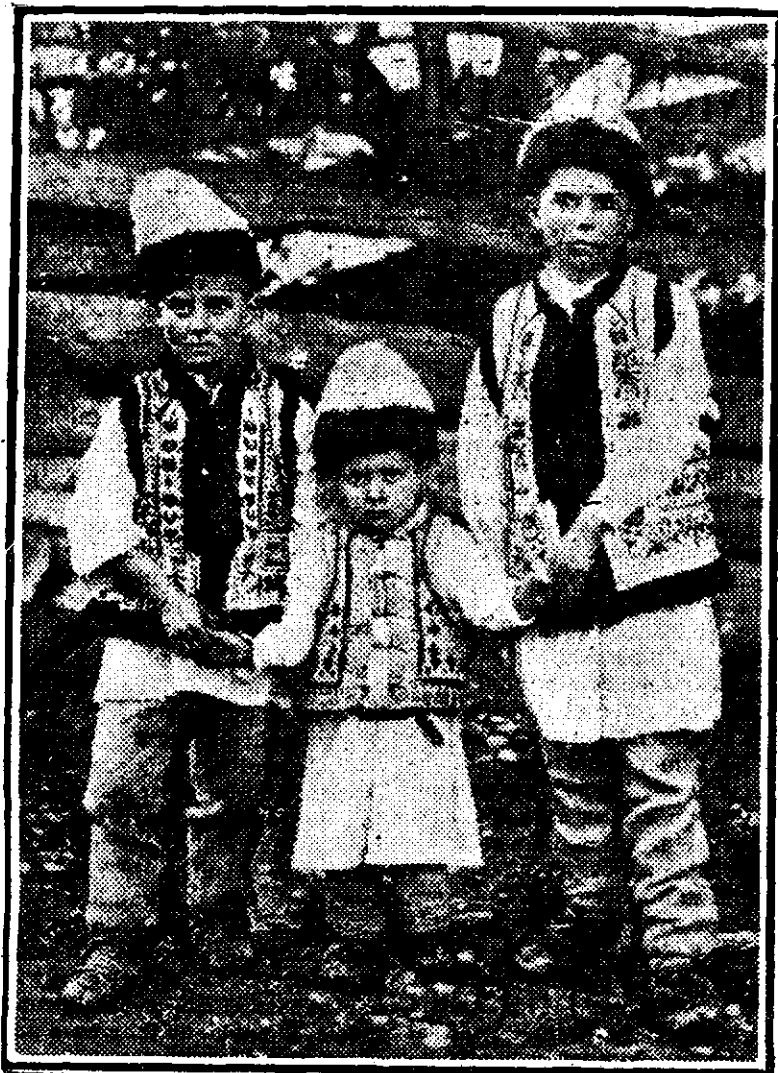
Costume naționale din Broșteni (Suceava)

„Ingerul morții venind lângă Mohamed, îi zise: Cel de sus m'a trimis să-ți îndeplinească voința. Dacă îmi vei porunci să-ți iau sufletul, ți-l voi lua; dacă nu, nu ți-l voi lua. Mohamed a răspuns: Ia-mi-l. Atunci arhanghelul Gabriel a răspuns: Dacă această e voința ta, fie, Dumnezeu dorește să te aibă lângă el. Eu pen-