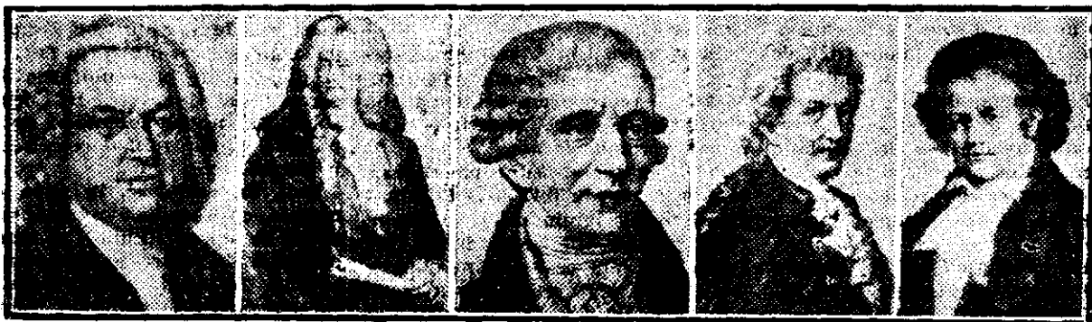
Bach Haendel Haydn Mozart Beethoven

Principali reprezentanți ai școlii clasice germane