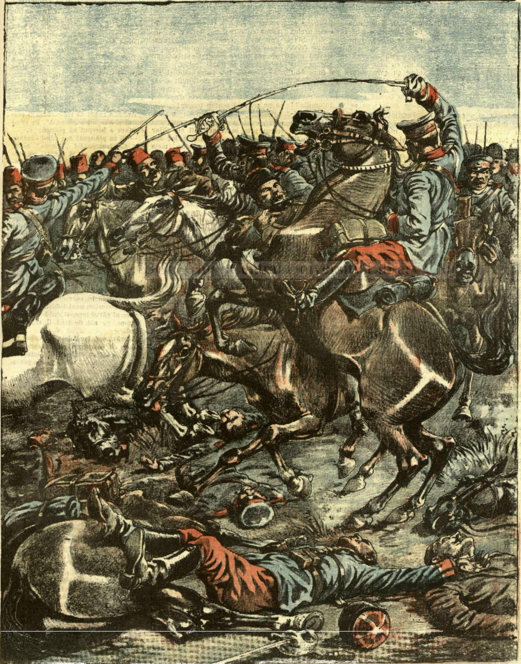
ATACUL TERIBIL AL CAVALERIEI SĂRBEȘTI LA CUMANOWO. — (Vezi explicația).

ANUNȚURI: — Linia pe pagina 7 și 8 bani 20 —