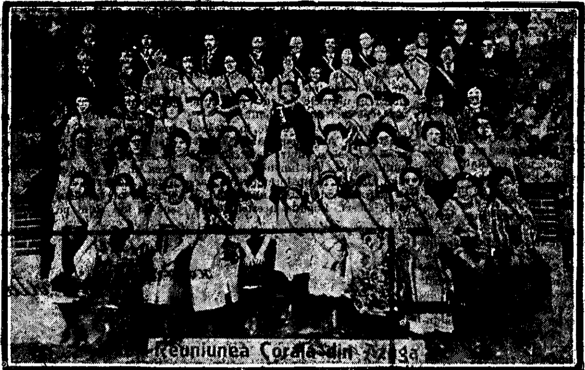
Reuniunea Corala din 1912

bea, o desmierda cu cele mai dulci cuvinte. I se umpleau ochii de fericire, când dansa gingașe și drăgălașe îi sărea în, caie cu brațul plin de flori, îmbălbătoare, cu ochii plini de dragoste și fericire, și când îi întindea gurița, fragă pentru o alinare.