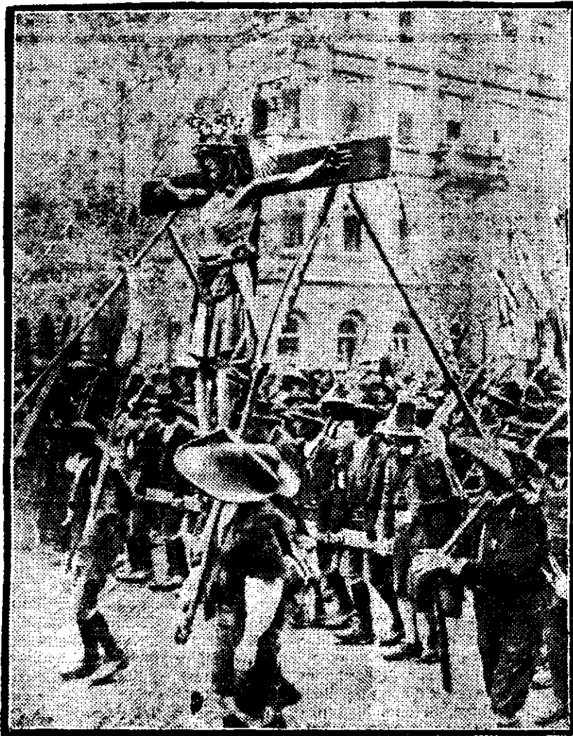
Locuitorii muntenii din Tyrol înarmați cu coase escortând pe Isus Christos în timpul procesiunii congresului.