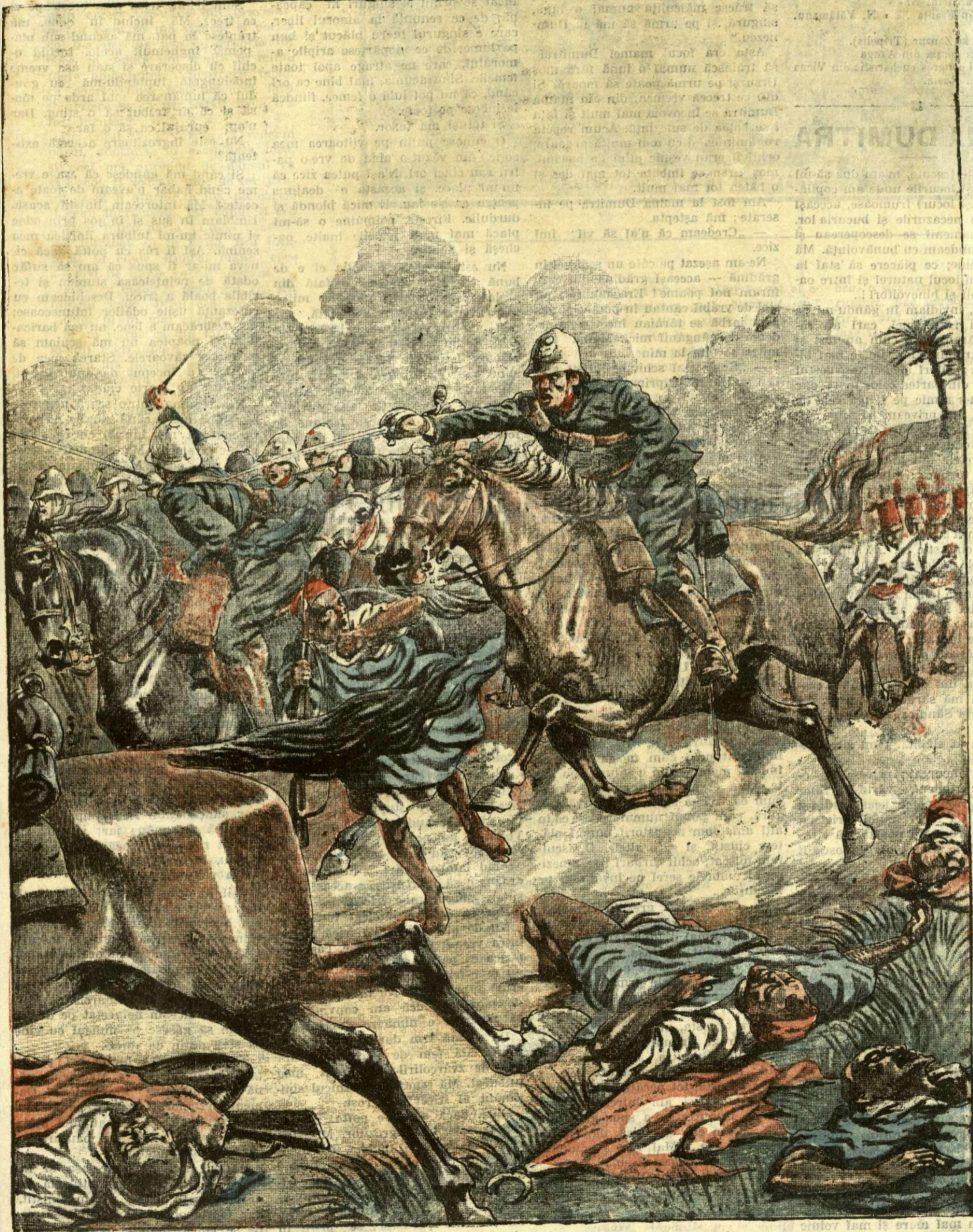
LUPTA DE LA ZANZUR (TRIPOLIS). — (Vezi explicația).

ANUNȚURI: — Că linia pe pagina 7 și 8 bani 20 —