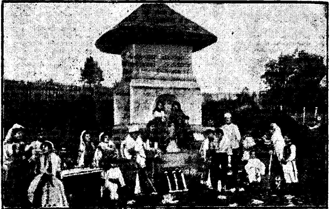
CURTEA DE ARGES. — FÂNTANA MEȘTERULUI MANOLE