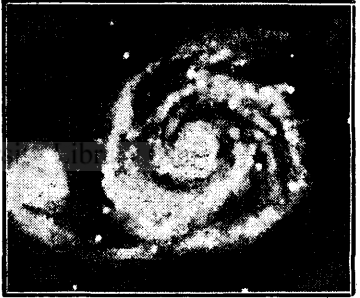
Nebuloasa în spirală din constelațiunea Câinii de vânătoare: unii învățați cred că o asemenea nebuloasă nu se poate naște decât din ciorăria a două sorii gigantice ce se stînseseră.

Omenirea pământescă va îngropa cu ea toate hozățiile materiale