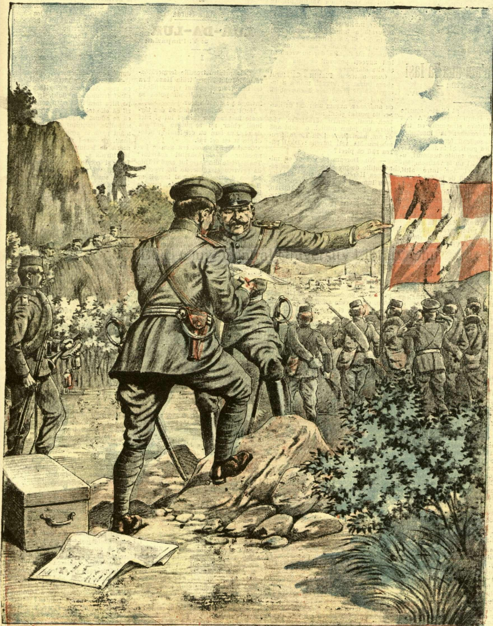
TRUPELE MUNTENEGRENE LA GRANITA TURCEASCA. — (Ves! explicația.)

ANUNȚURI: — Zărire pe pagină 7 și 8 bani 50 —