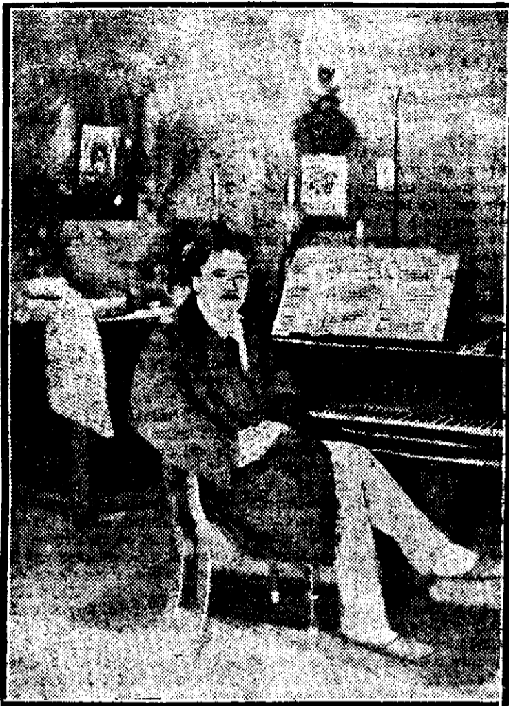
Massenet ca student la Roma