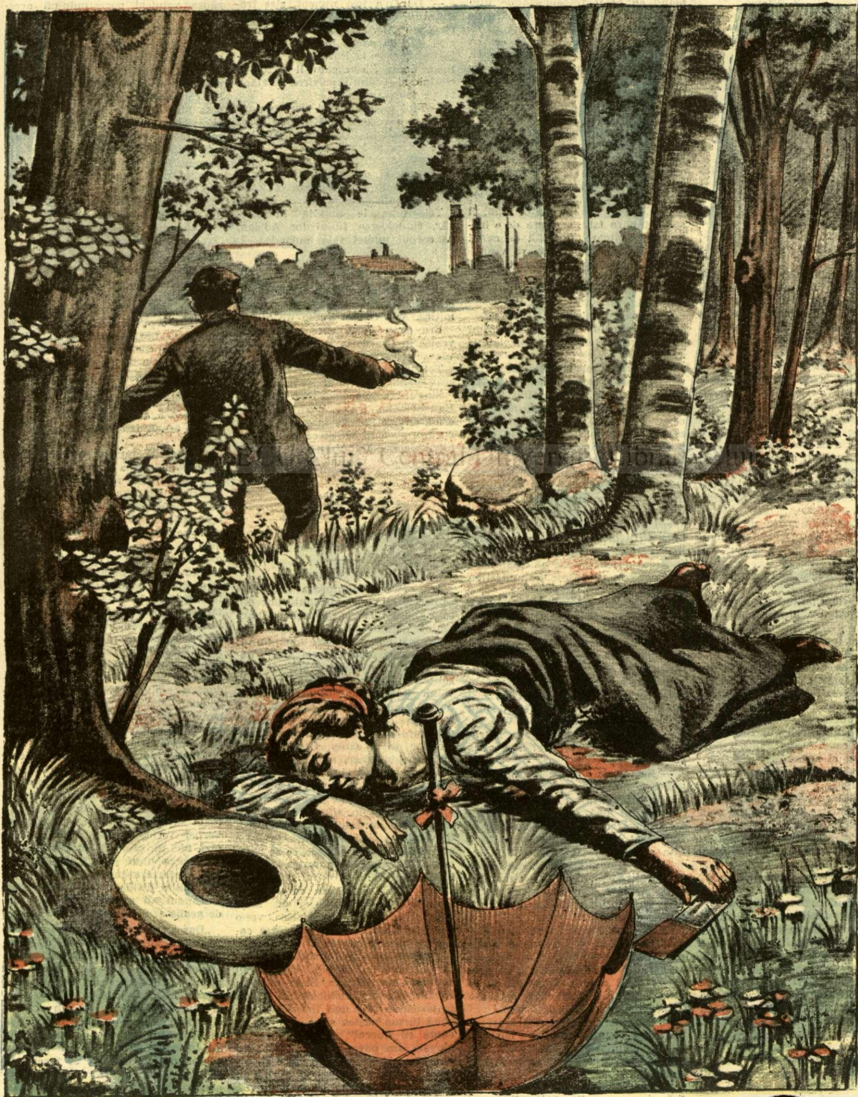
CRIMA DE LA MOARA CIUREL DIN CAPITALA. — (Vezi explicația)

ANUNȚURI: — Linia pe pagina 7 și 8 bani 20 —