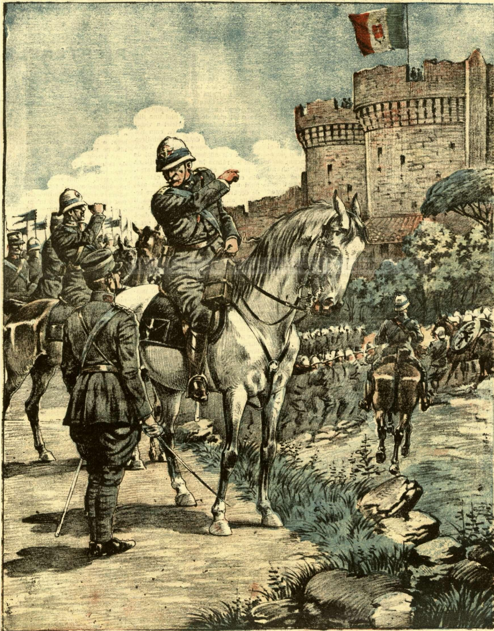
CUCERIREA INSULEI RHODOS DE CATRE ITALIENI. — (Vezi explicația).

ANUNȚURI: — Linia pe pagina 7 și 8 bani 20 —