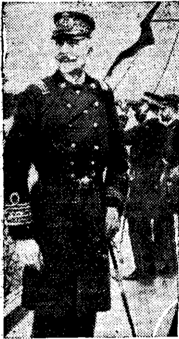
Comandantul escadrei italiene din Mediterana, mort la 4 Martie st. n.