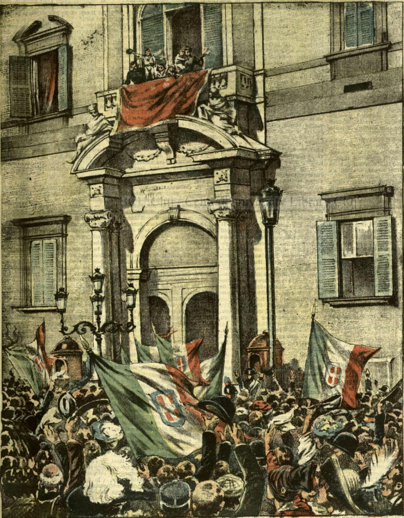
Principele moștenitor al Italiei mulțumind pentru manifestația de dragoste. — (Vezi pag. II).

ANUNȚURI: — Linia pe pagina 7 și 8 20 bani —