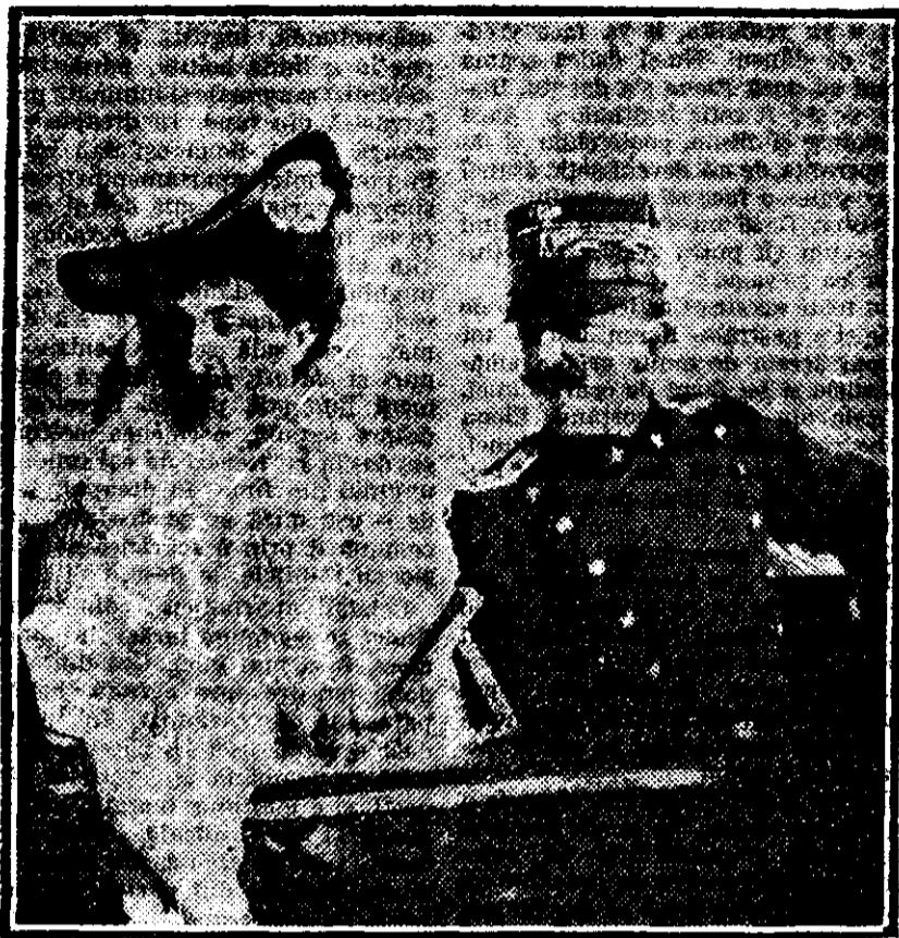
SUVERANII ITALIEI, în trăsură, înainte de atentat

Hotărât, anul acesta am avut cel mai bogat sezon musical! Nici odată nu s'a întâmplat să treacă atâtea celebrități pe la noi într-un răstimp de patru luni de zile, așa că se po- te spune că sezonul acesta musical a fost un adevărat șir de evenimente