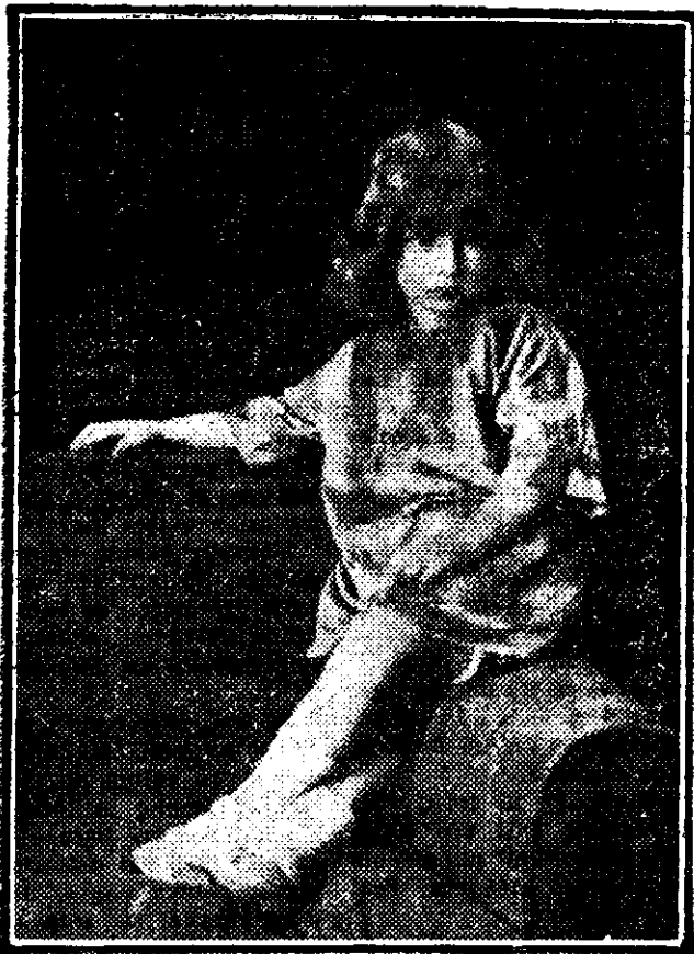
(după cea mai recentă fotografie)

Călugărul, ba, întinde numai mâna în lungul drumului, arătându-i-l: te duce drept la poarta târgului.