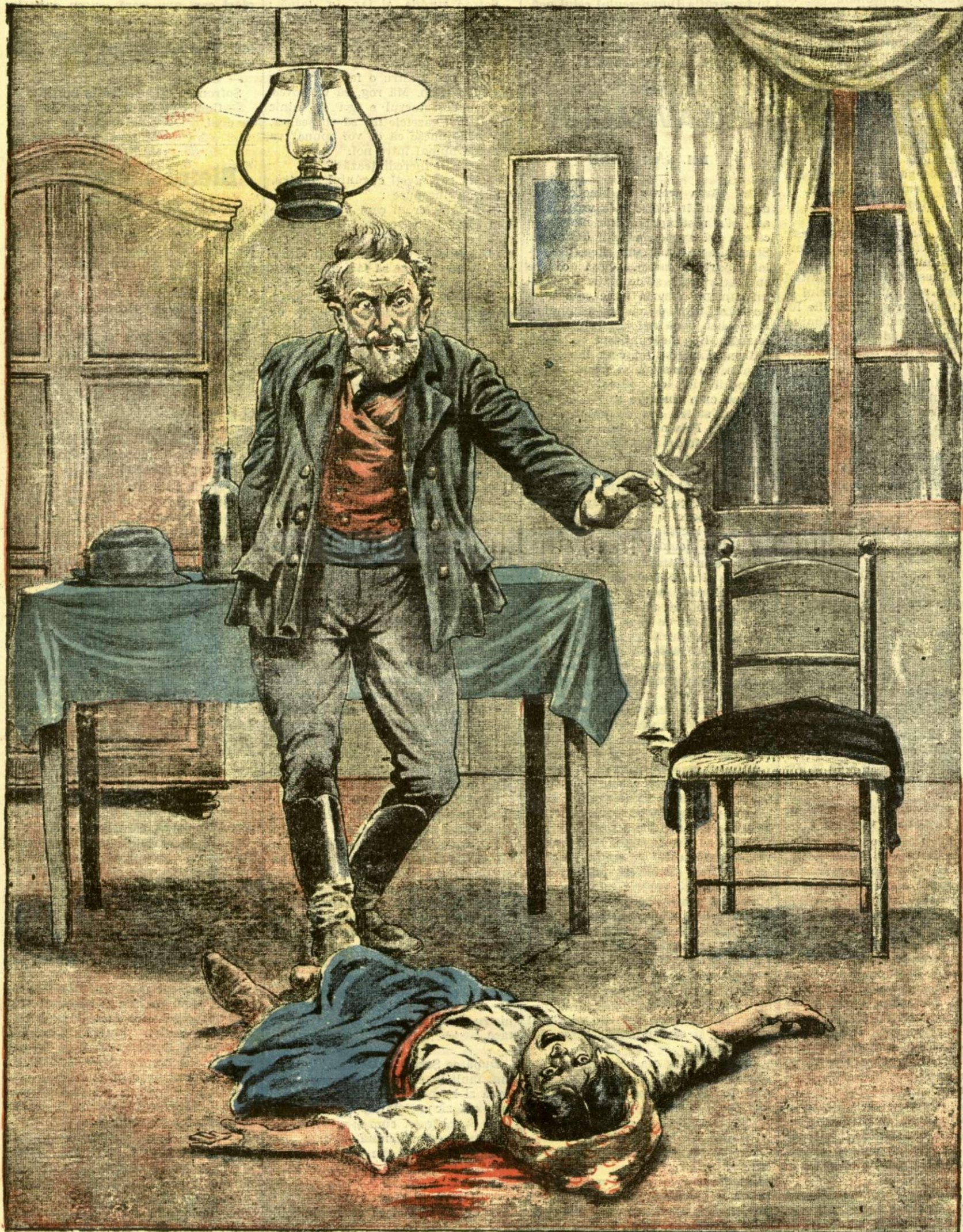
CRIMA INGROZITOARE A UNUI PRIMAR. — (Vezi explicația)