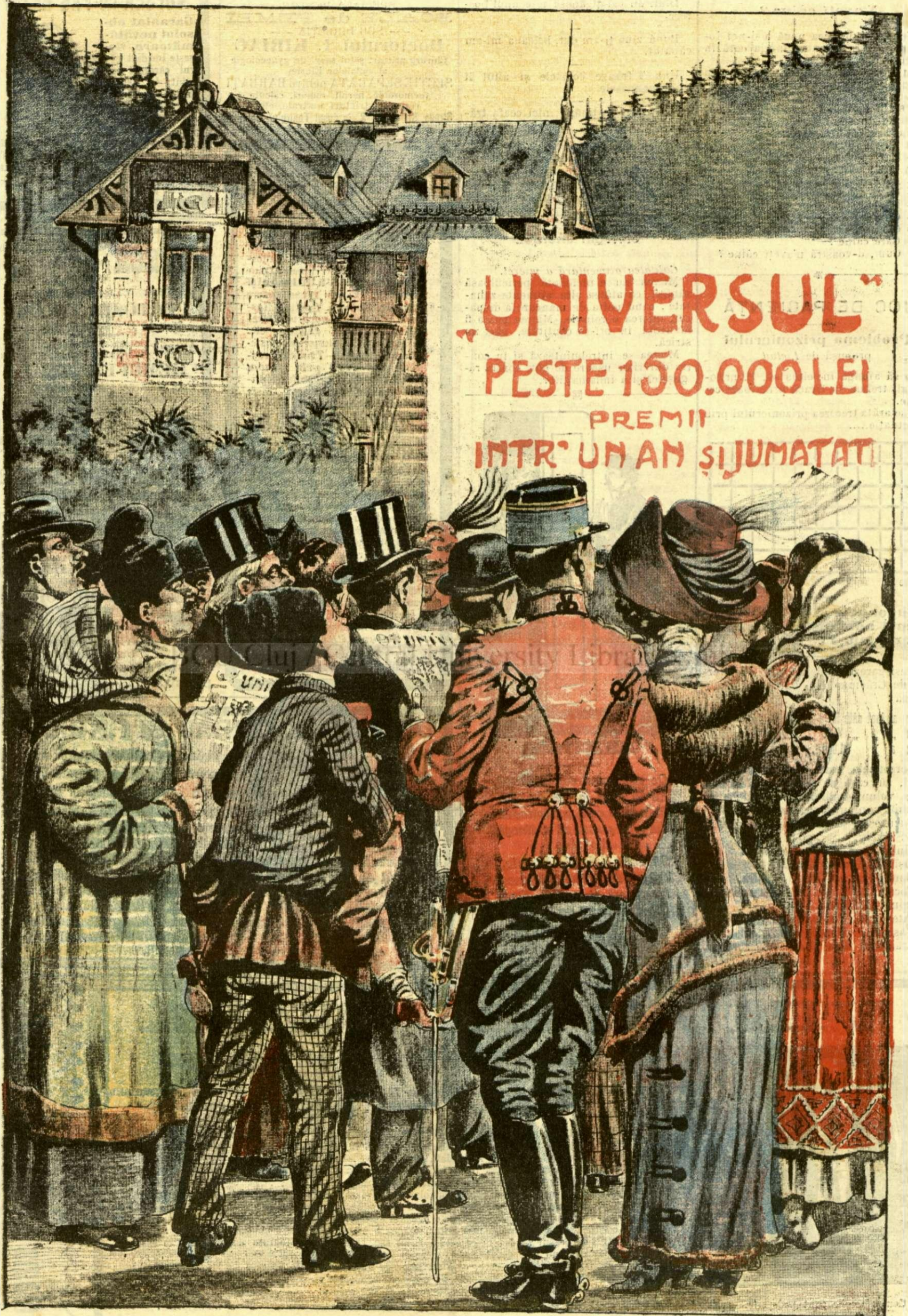
PREMIILE «UNIVERSULUI» PE ANUL 1911.