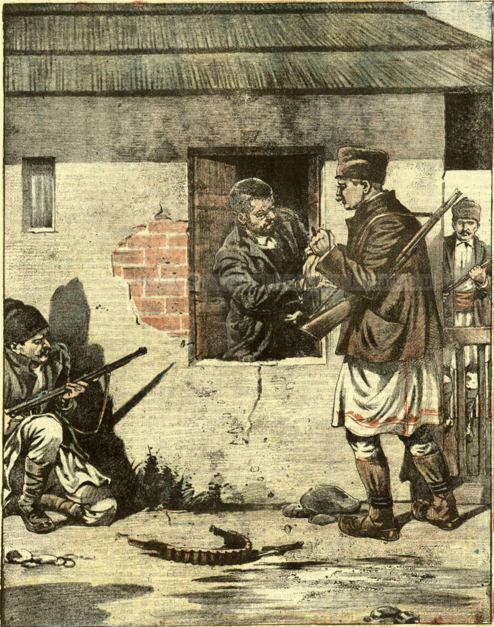
PRINDEREA VESTITULUI BANDIT TEODOR PANTELIMON. — (Vezi explicația).