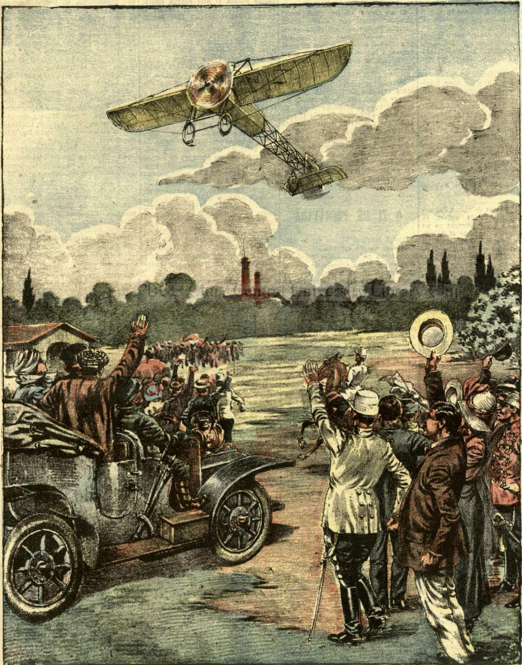
AVIAȚIUNEA IN ARMATA ROMANA. — (Vezi explicația).