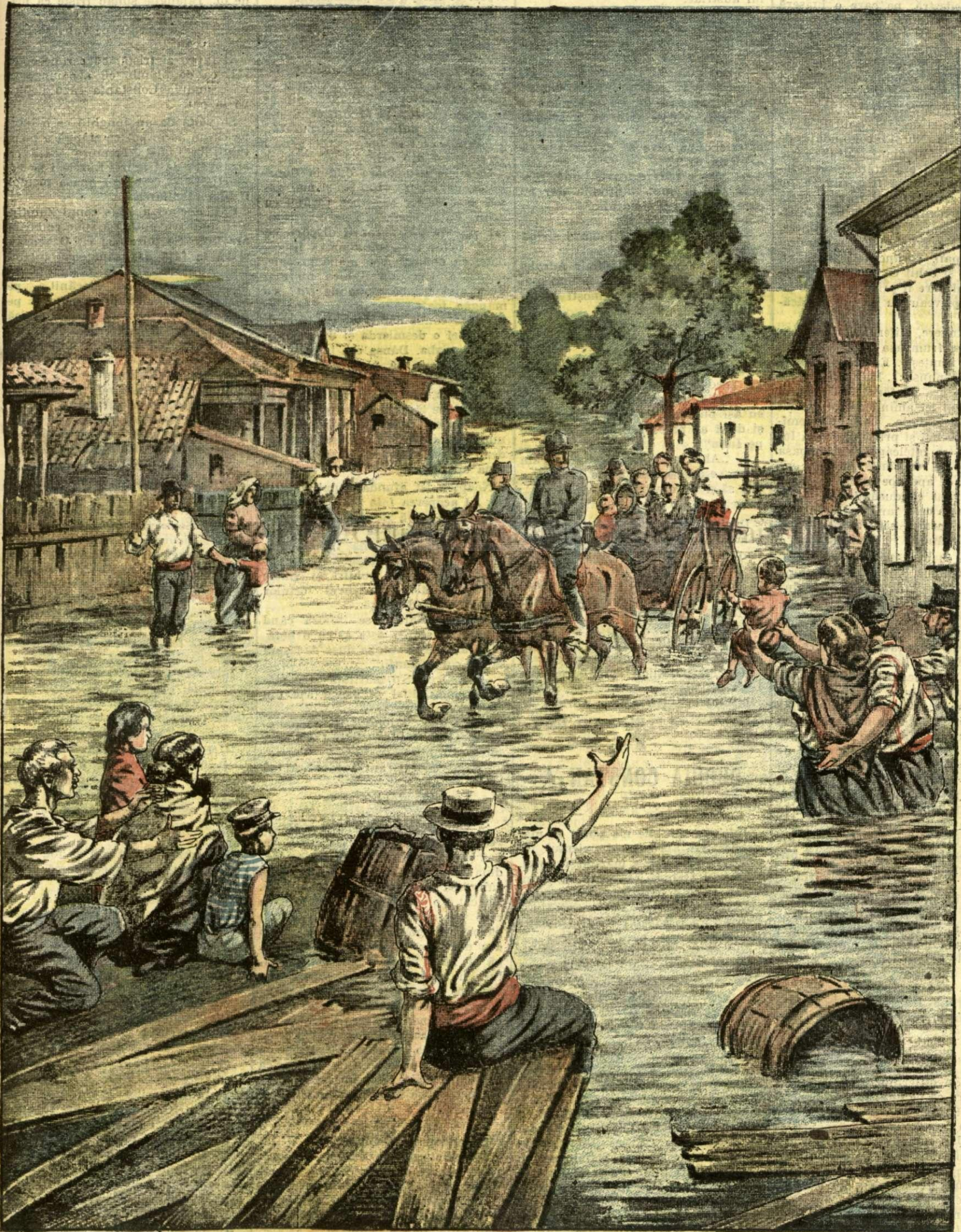
GROAZNICELE INUNDAȚII DIN MOLDOVA. — (Vezi explicația).