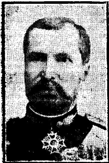
Dăm azi la galeria parlamentarilor noștri portretul d-lui general Tell, vice-președintele Senatului.

Un distinsă personalitate militară, d-l general Tell este și o distinsă personalitate parlamentară care onorează maturul corp.