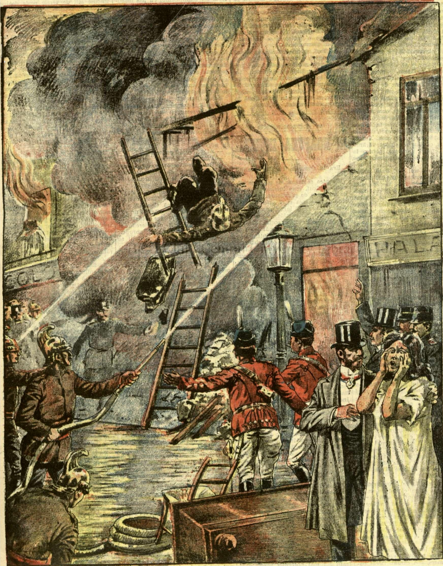
MARELE DEZASTRU DIN BRĂILA. — (Veze explicația).