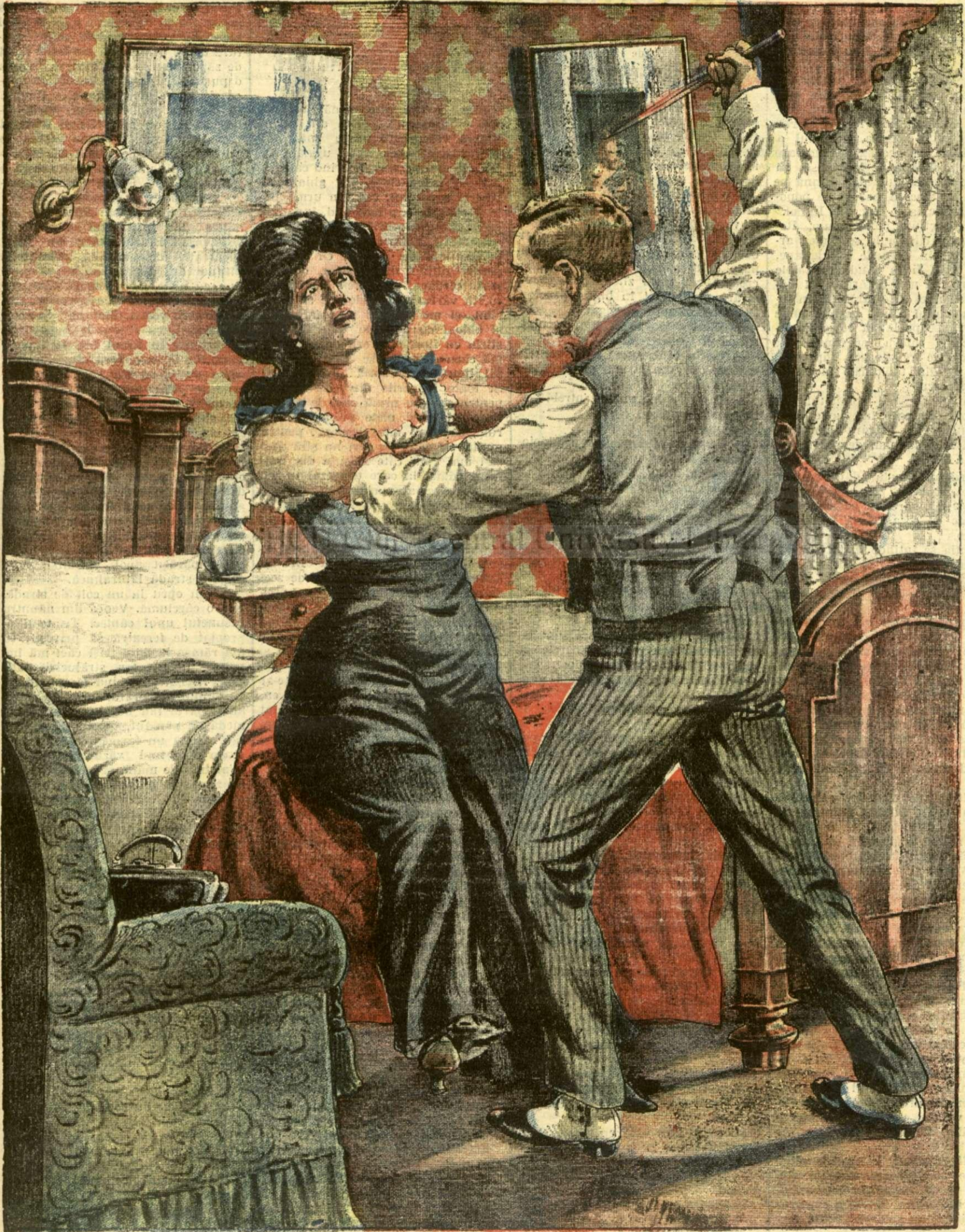
INFIORATOAREA DRAMA DIN ROMA. — (Vezi explicația).