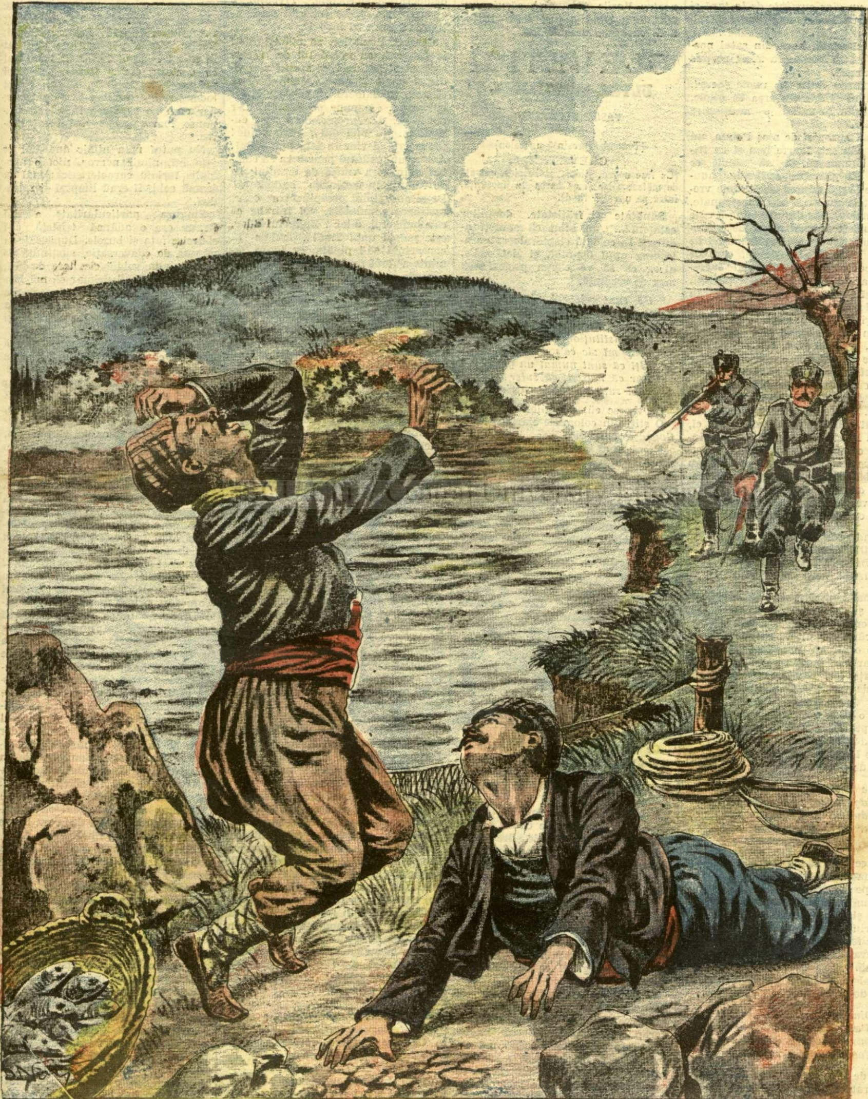
● NOUA CRIMA A BANDELOR DIN MACEDONIA — (Vezi explicația).