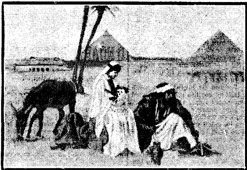
REPAOSUL IN EGIPT (după tabloul d-lui J. J. Aubert).

— Ascultă, la întoarcere să iei o căruță căci nu va trece mult și vom avea un viscol cum nu s'a pomenit de mult, și de la oraș și până acilea ai de furcă; iar drumul e rău de tot, căci del șosele tot nu s'au făcut peste tot locul. Ascultă, măi zise moș Zăgură, oprind încă o clipă pe grămătic, sunt de opt-zece doi ani și știu multe... când e vorba de copii, doctoriile sunt de geaba, să te ferească Domnul de doctori și de spiteri! Tot e Crăciunul; să-ți dau eu un leac mai bun. Știi crucea de piatră, de pe vârful dealului? Acolo, în noaptea de Crăciun, sunt acum șai-zece de ani, s'au înămolit doi