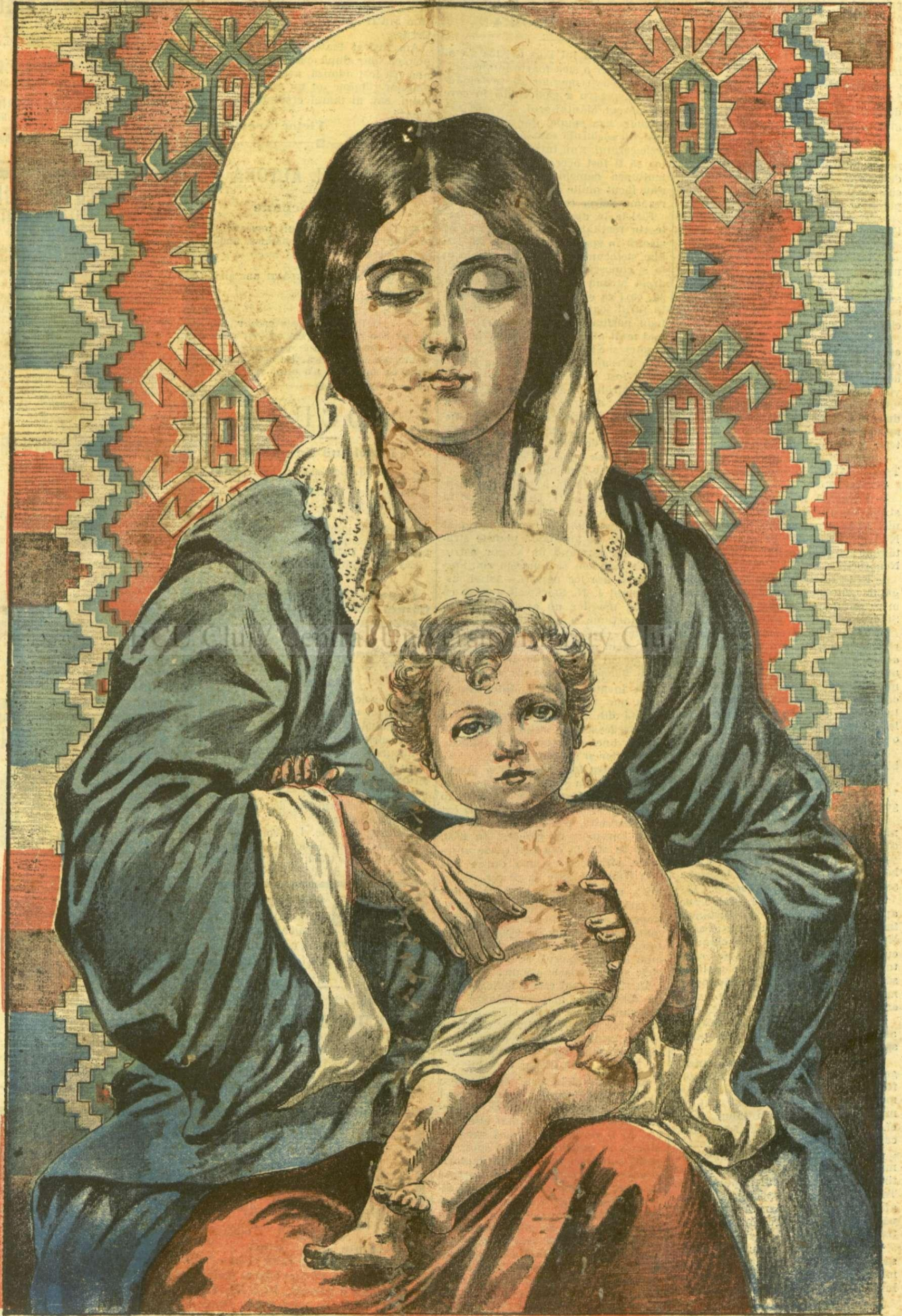
Maica Domnului cu fiul său Isus Christos.