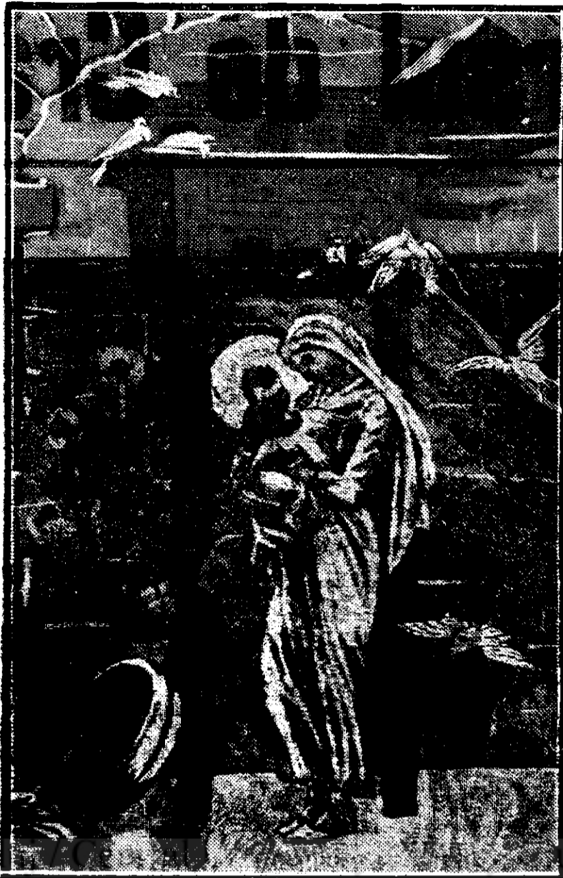
PRUNCUL SAU SFANT (după tabloul d-urii Demost-Bryton)

Așa s'a născut Mântuitorul, și nici un cuvânt de slavă către el, și nici o urare mai creștinească nu se