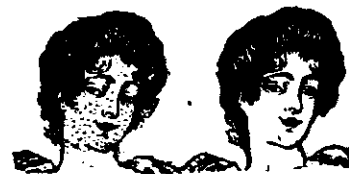
Înainte și După Intrebujirea Cremii și Pudrei «Flora».

se obține prin întrebuințarea cremei și pudrei FLORA preparate de Al. Itoanu farmacist, furnisor al Curții Regale. Pudra «FLORA» fără bismut mărește efectele uimitoare ale cremei «FLORA». Crema lei 1,50. Pudra «FLORA» lei 2. Săpun Flora lei 1,25. Pomadă de păr «Flora» gătită pentru îngrijirea rațională și igienică a părului, lei 2,50. Capilogen «Flora» (apă de păr) sticlă mare lei 3,25, mică 2,50. Pasta de dinți «Bucol» lei 1. Apa de gură «Bucol» lei 1,50. Lapte de erin «Flora» pentru înfrumusețarea tenului lei 2. Săpun de Lapte de erin «Flora» lei 1,25. La neputință se restituie imediat costul.