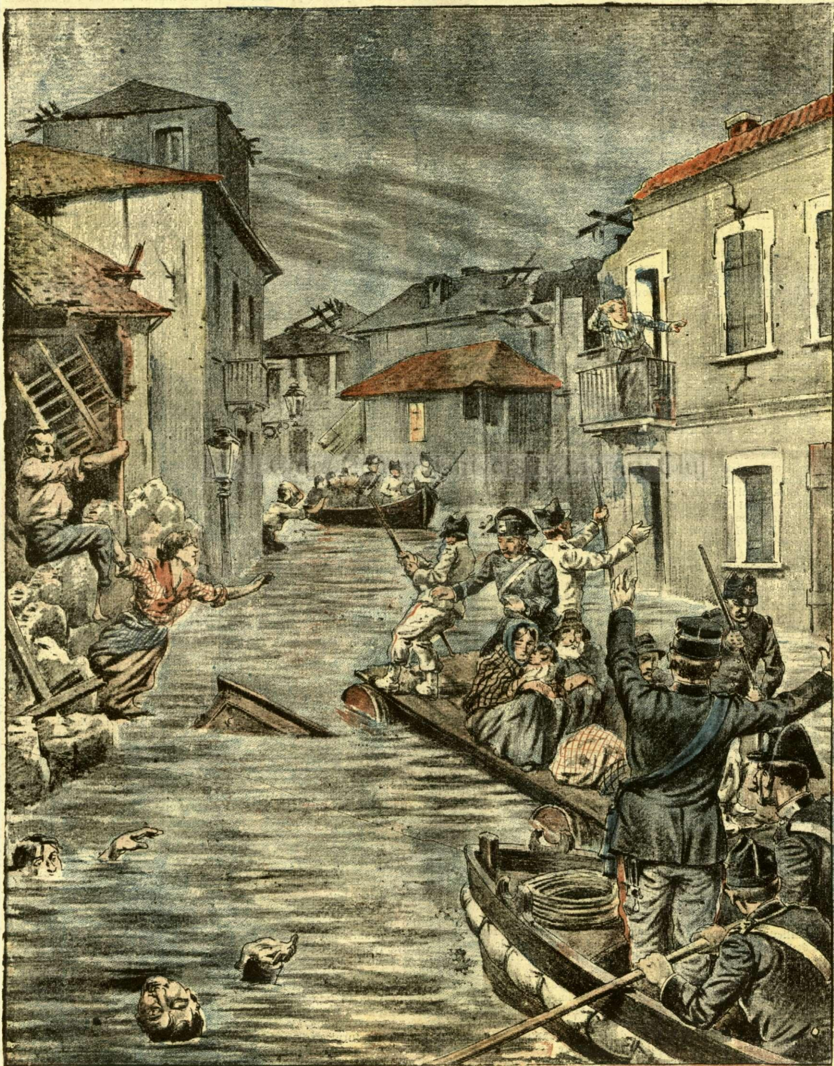
MARILE INUNDAȚI DIN SUDUL ITALIEI. — (Vezi explicația).