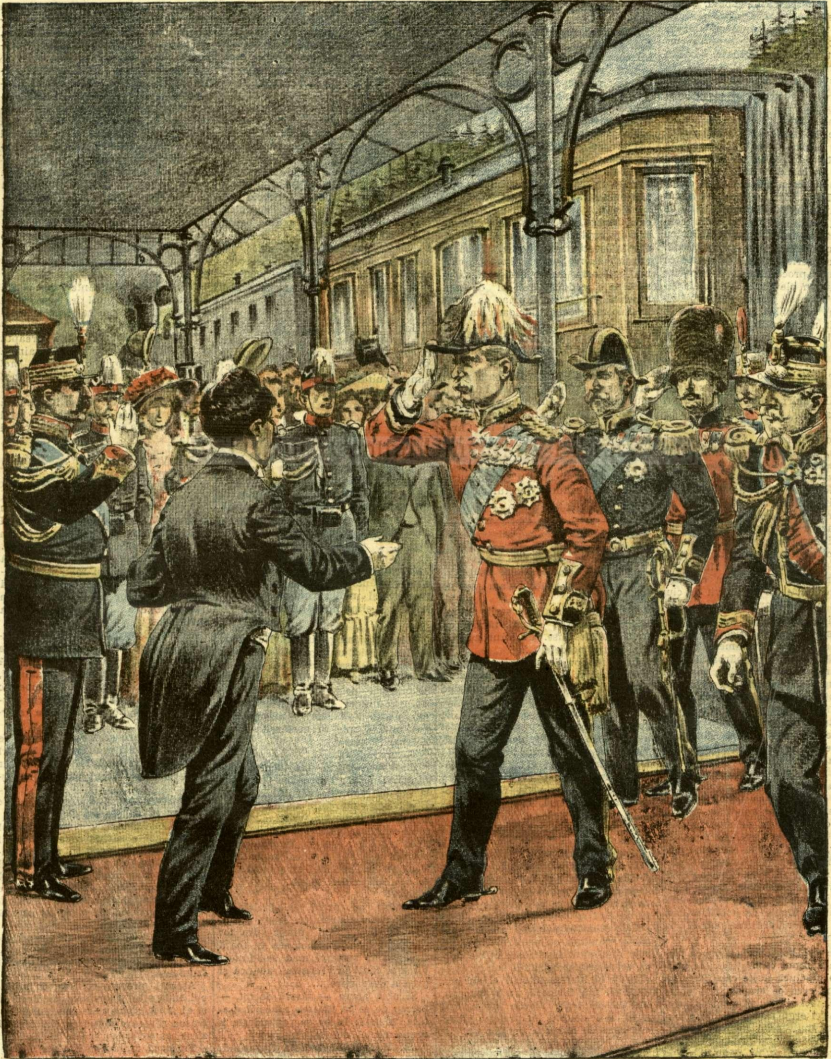
SOSIREA MISIUNEI ENGLEZE LA SINAIA. — (Vezi explicația).