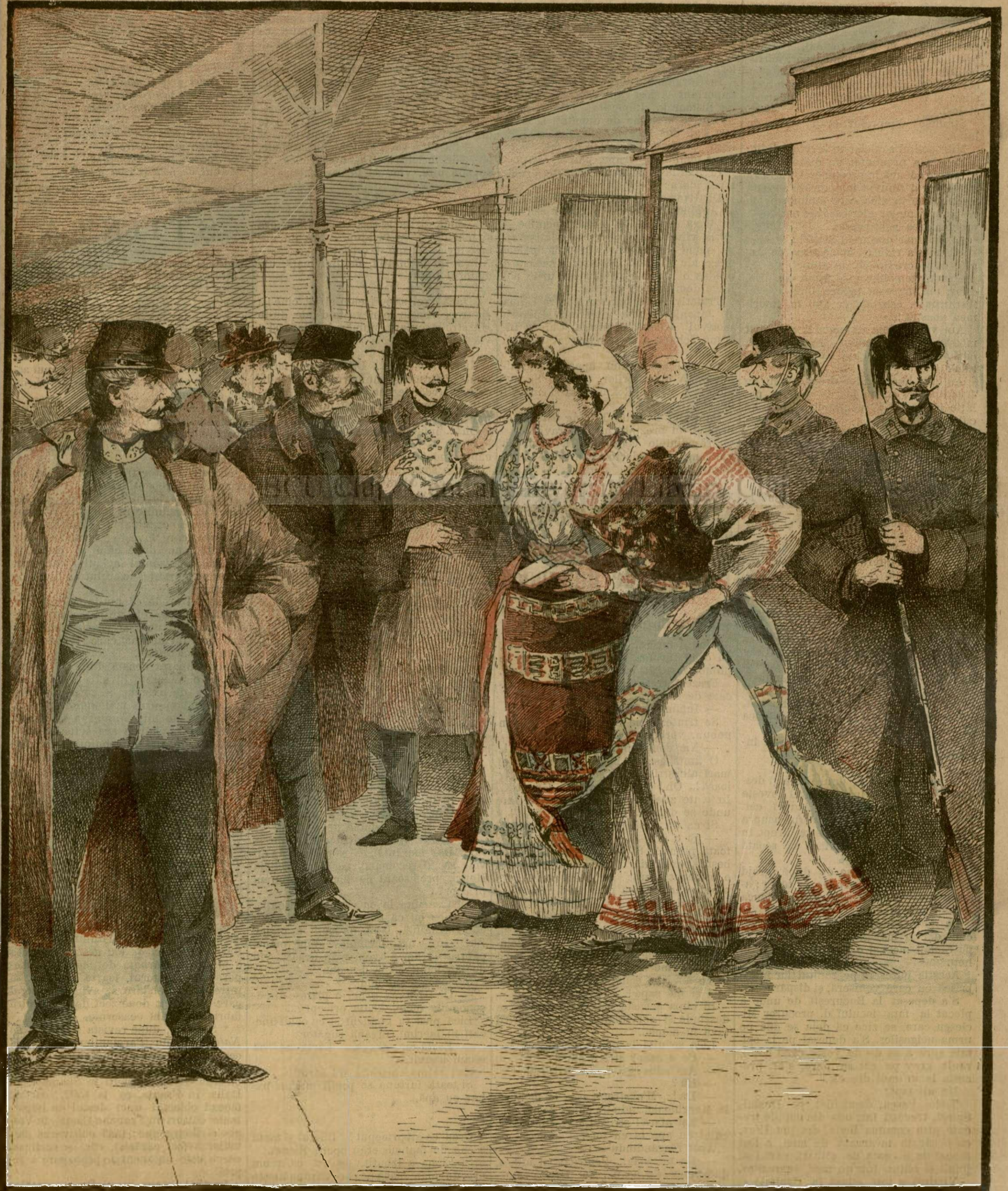
D-soarele române de peste munți oprite la graniță.—(Vezi explicația).