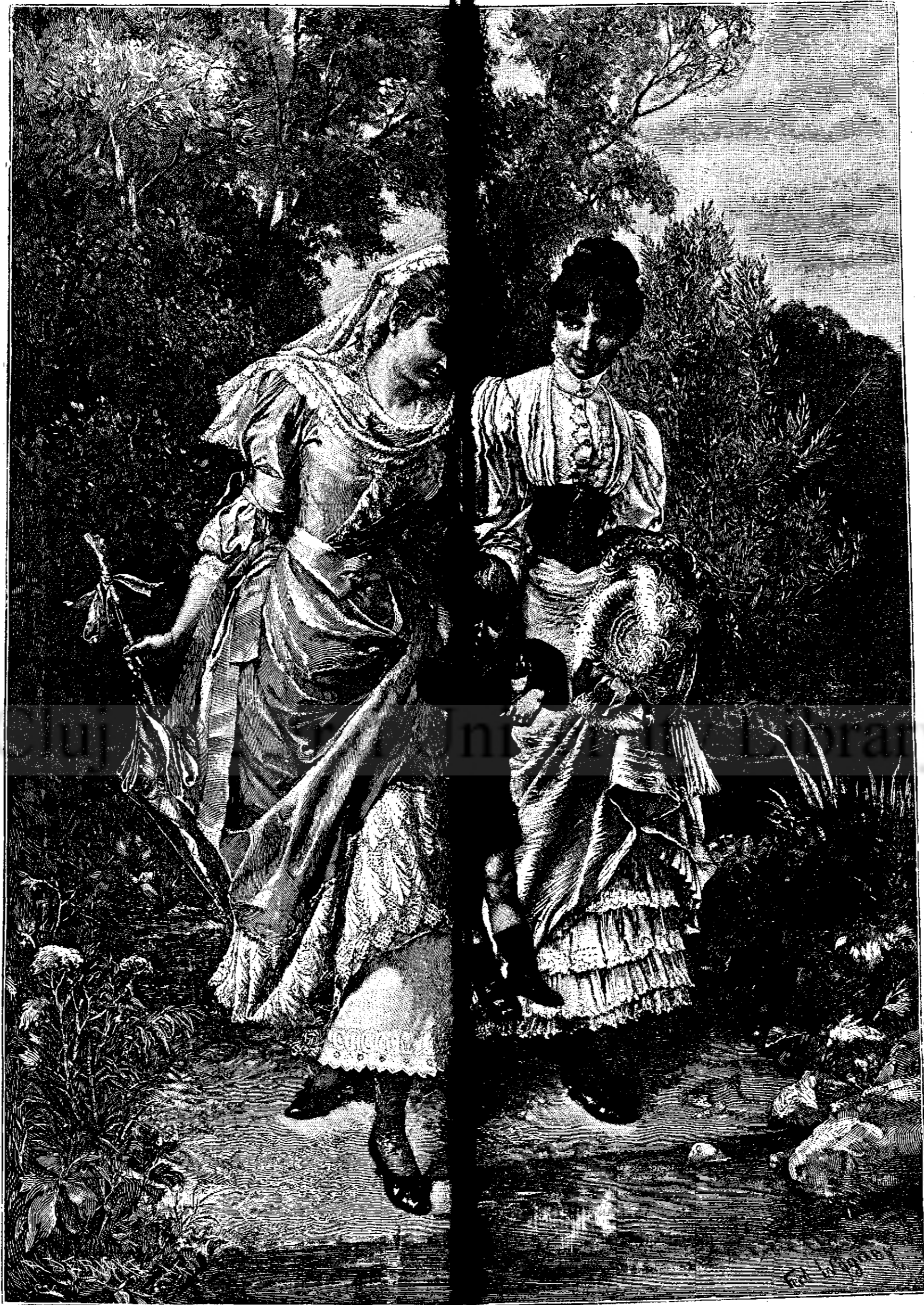
MOȘTENITOU L.—(Vezi explicația).

— Și se simți cu adevărat foarte mic, foarte vinovat când nevastă sa îl primi prin aceste cuvinte: — Ah, iată te în sfârșit! — Dar, scumpa mea draguță, dacă aș fi putut crede că lipsa mea te in-dispune?... De ce nu mi-ai scris? — O! d-ta era ocupat cu lămurii, cu aparate frigorifice... Ce 'i păsca d-taie că sunt eu în primejdie de moarte.