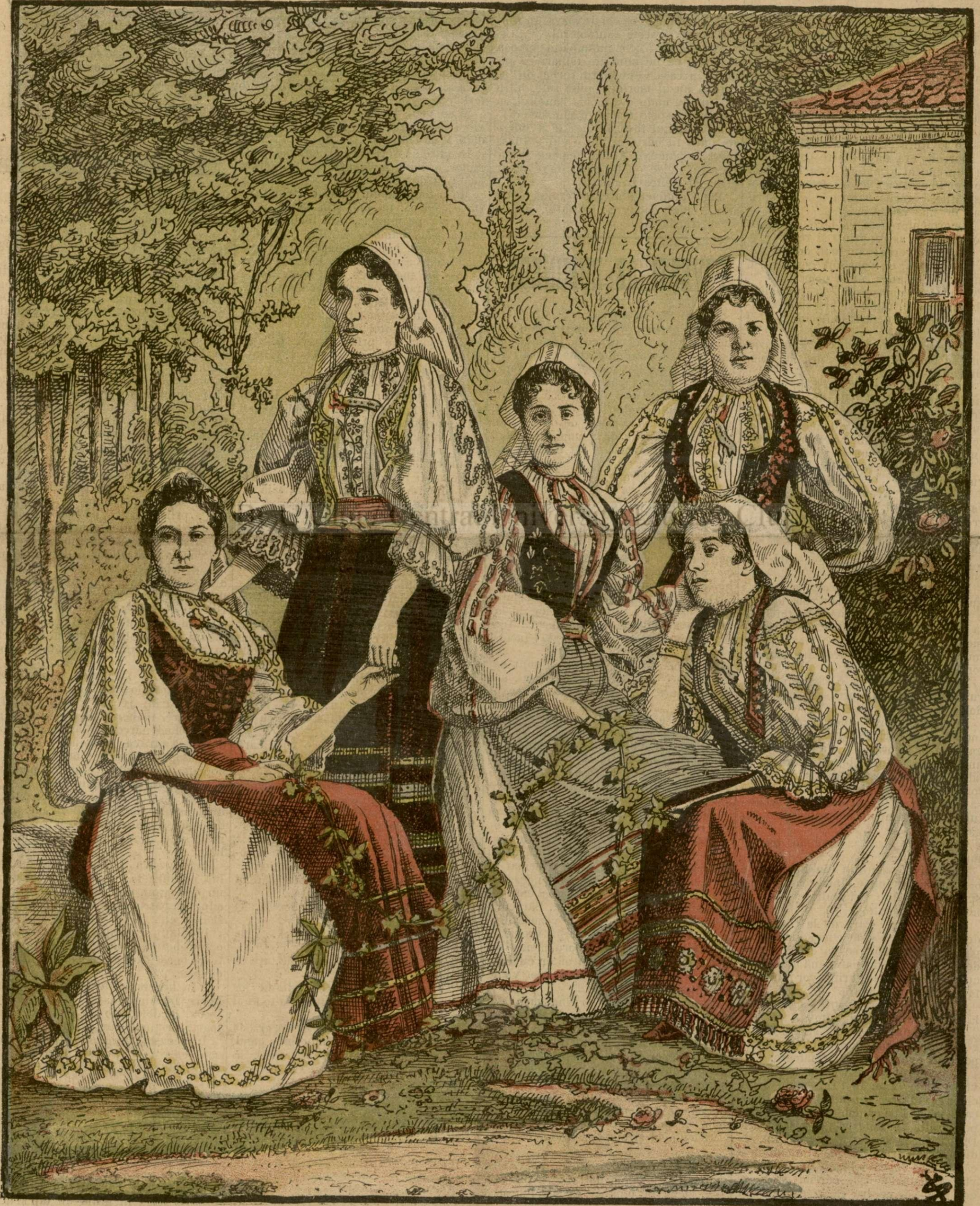
D-soarele române de peste munți date în judecată.— (Vezi explicația)