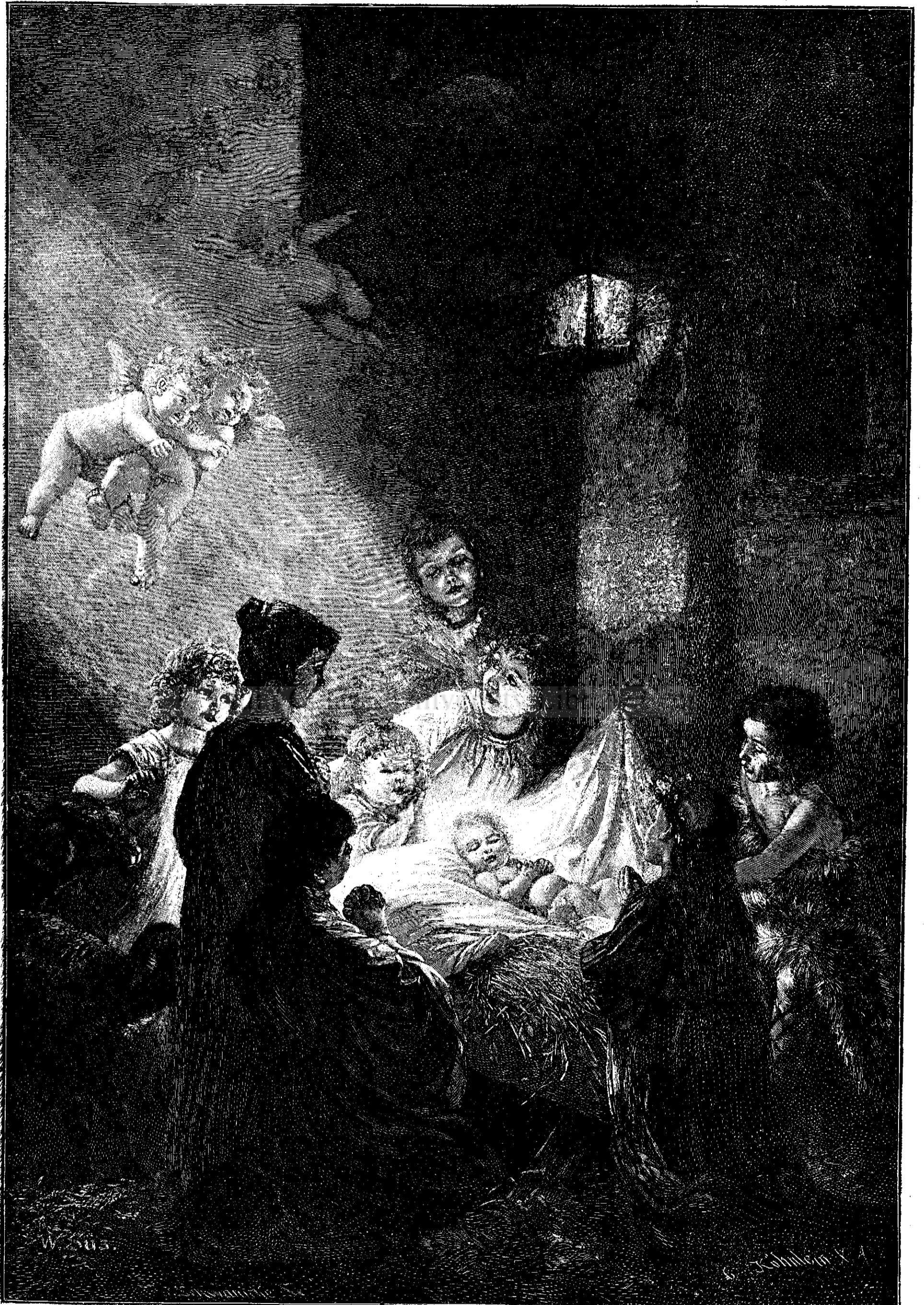
Nașterea lui Isus Christos. — (Vezi explicația)