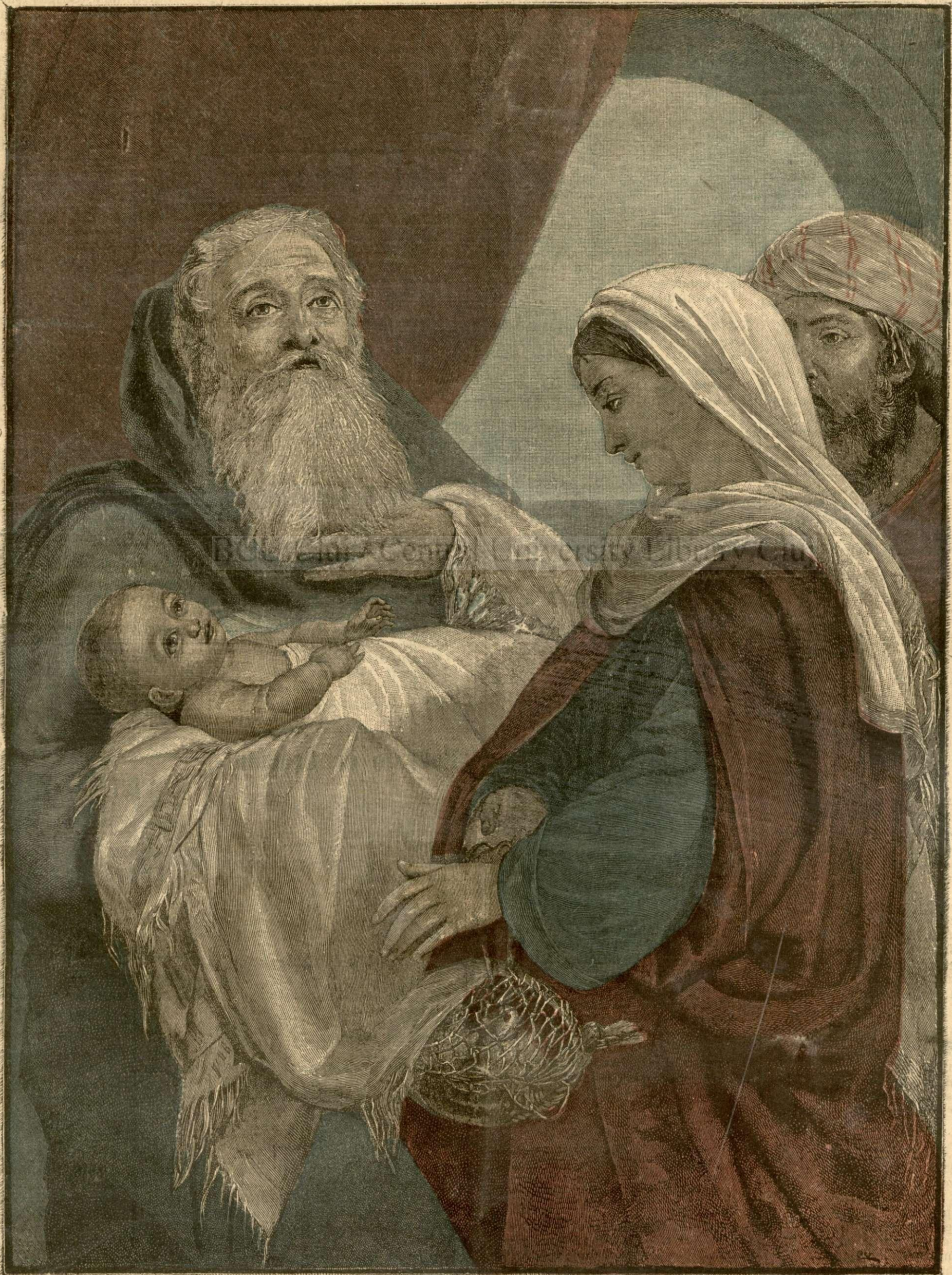
SFÂNTUL SIMEON. — (Vezi explicația)