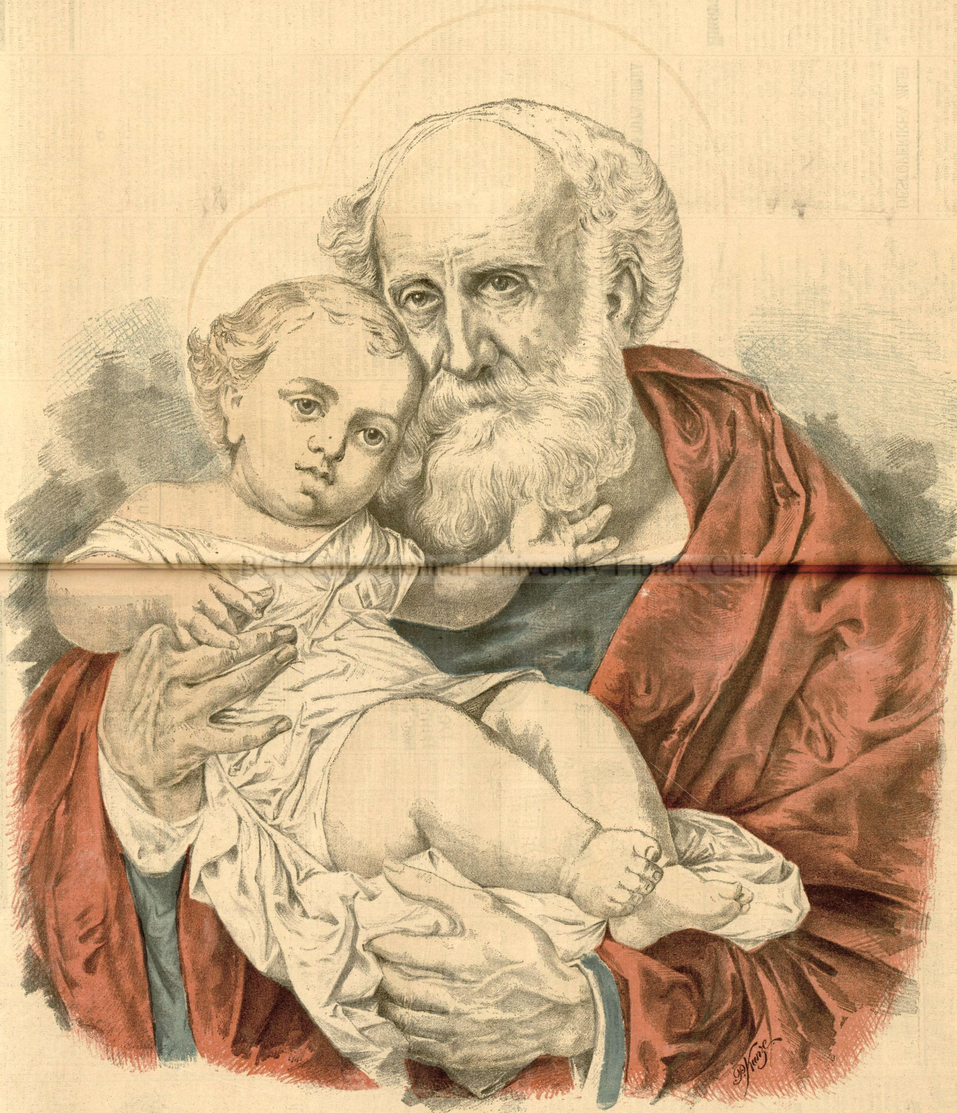
SF. IOSIF ȘI ISUS CHRISTOS. -- (Vezi explicația).