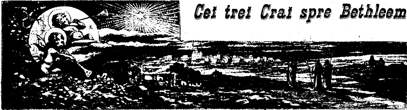
Cei trei Crai spre Bethleem