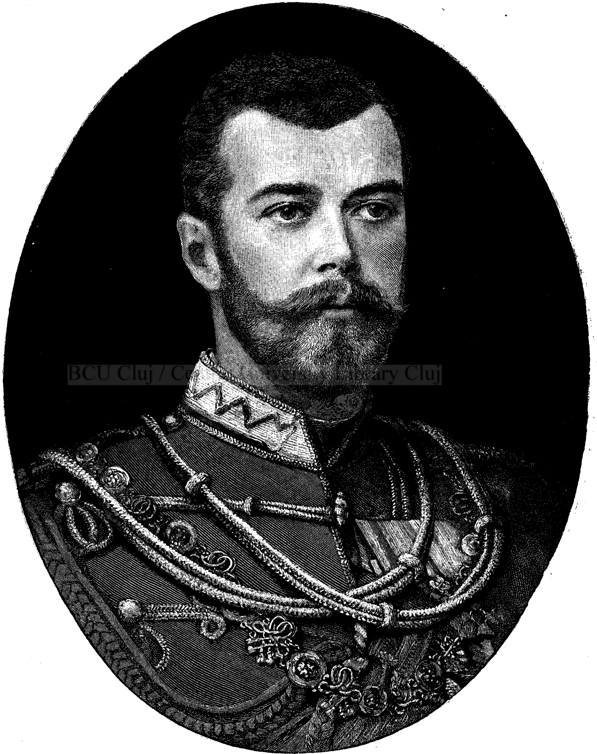
Impăratul Nicolae II