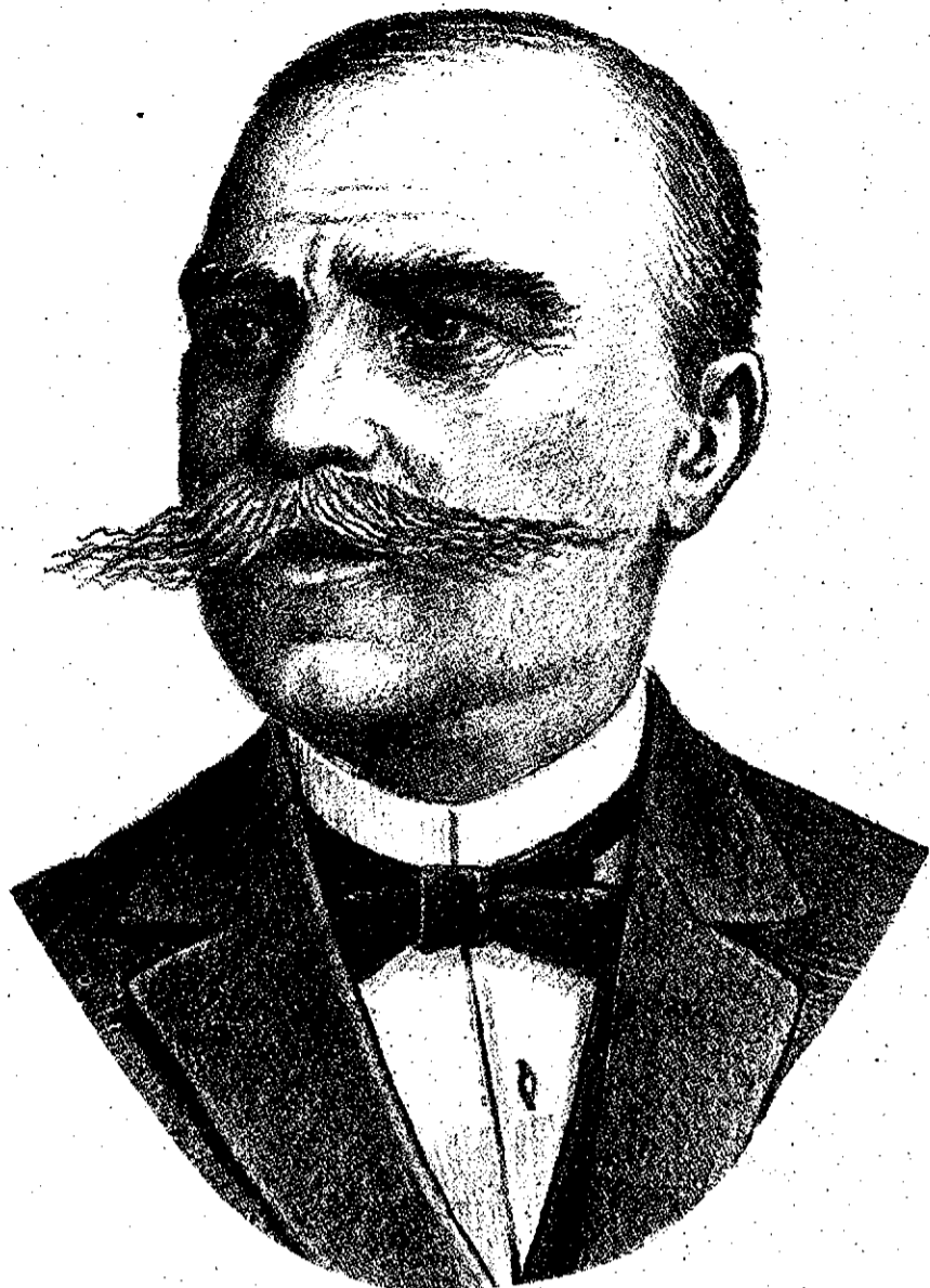
Dr. Ioan Rațiu