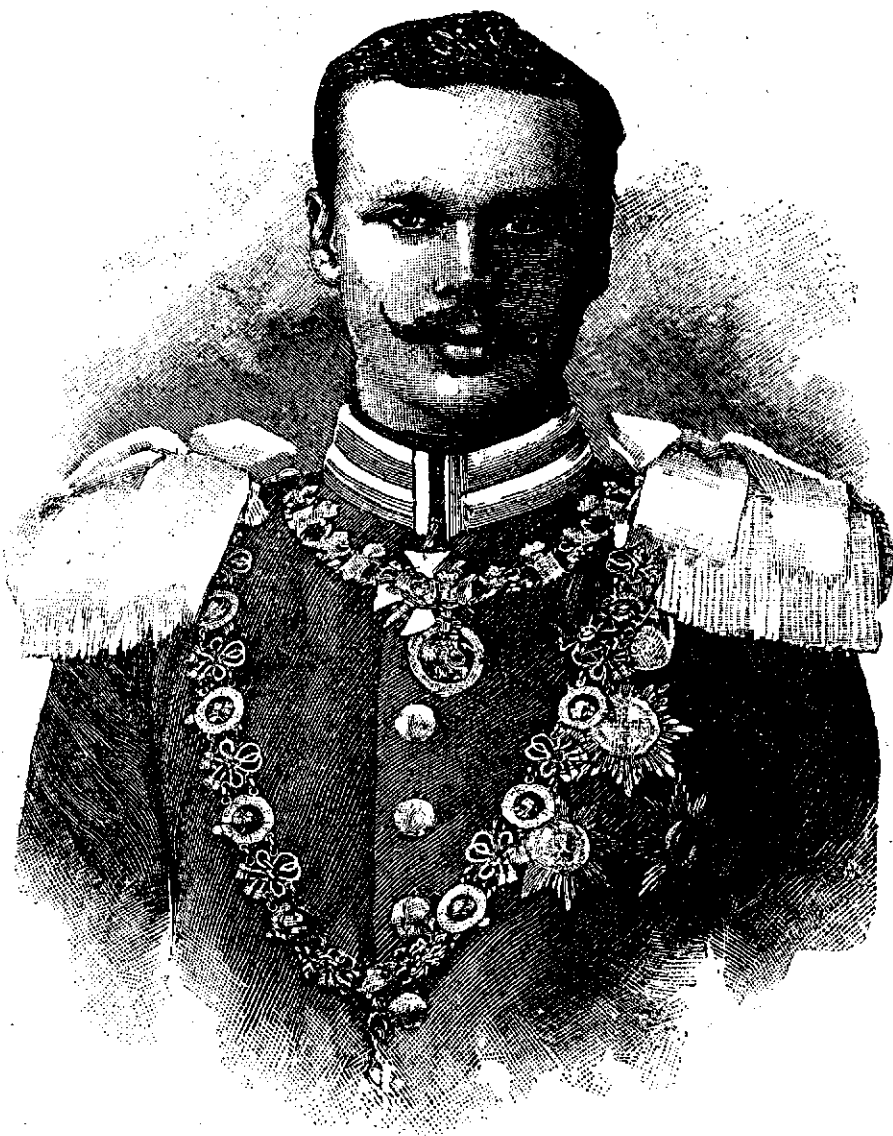
Marele duce de Hessa.—Vezi explicația

Negustorul rămase mirat auzindu-l vorbind de repararea castelului, de curățirea iazurilor, de îngrădirea parcului cu un zid înalt.