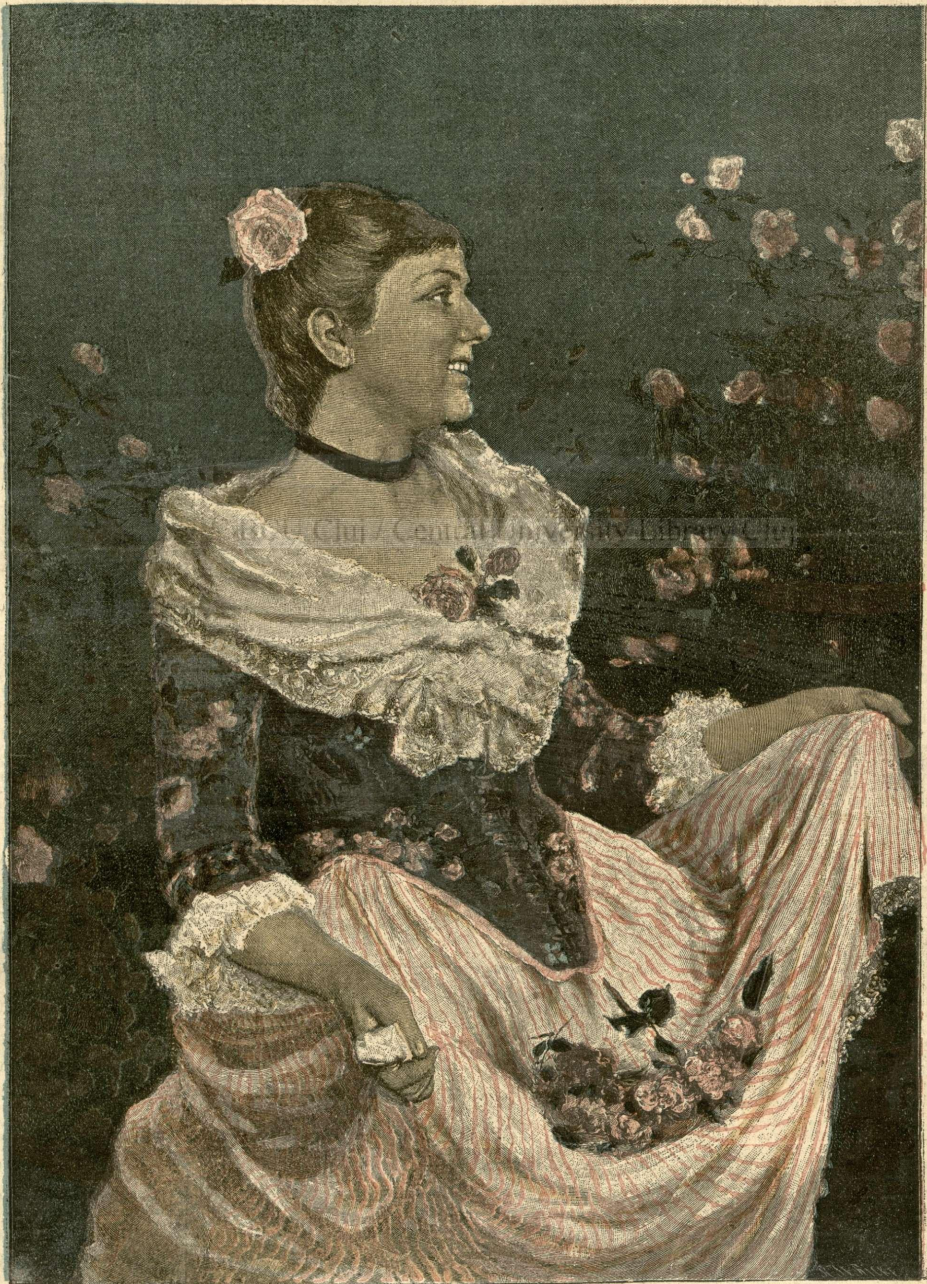
Primăvara. — (Vezi explicația).