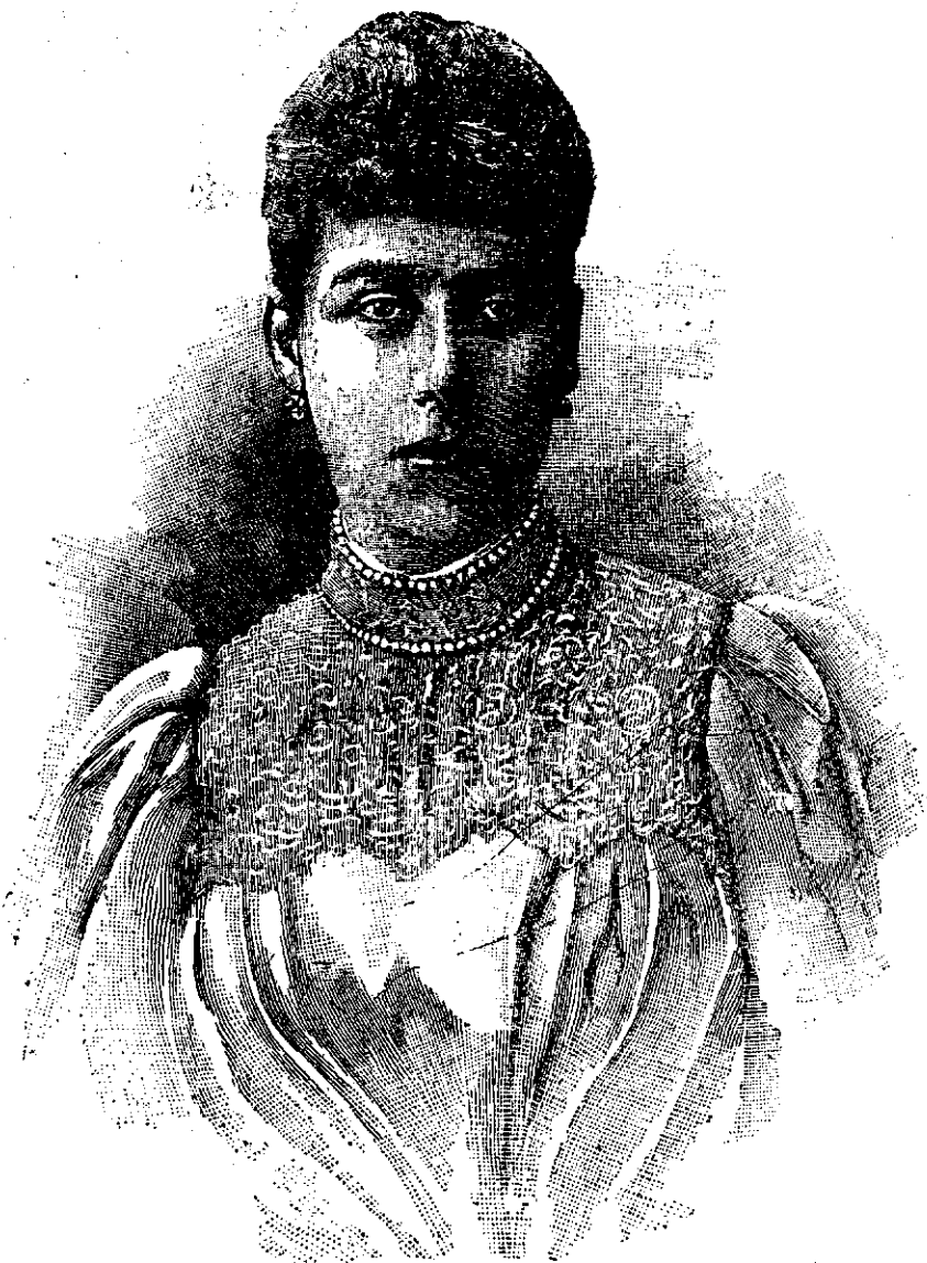
Princesa Victoria-Melita. — Vezi explicația