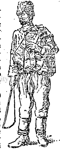
Moldovan din nordul Basarabiei. de (Des. C. Motaa).

Bulgarli (130 mii), refugiați în Basarabia din pricina schingiuirilor turcești, erau socotiți de cârmuirea moldovenească ca „bejenari”, oploșiți vremelnice. După 1812 Rușii i-au împământenit, i-au scutit de dări și armată și le-au dat 500 mii ha de pământuri și mijloace pentru a întemeia gospodăria. De aceia au astăzi o bună