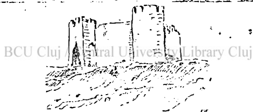
Cetatea Soroca. (Des. C. Motăș).

Orașele cuprind 15% din populația Basarabiei; ceea ce ne arată că comerțul și industria sunt slab dezvoltate. O mare parte din locuitorii orașelor sunt mici agricultori, care se mai îndeletnicesc și cu transportul. Vin apoi negustorii care, în cea mai mare parte, sunt mijlocitori între micii agricultori de la țară și marii cumpărători de grâne; afară de aceștia mai sânt meseriași, funcționari și alte grupuri mai mici de orașeni. De fapt orașele basarabene sânt mai mult centre administrative, militare și școlare. Insemnătatea de orașe industriale și comerciale sub Ruși n'au putut-o căpăta, căci aceștia au căutat să ridice alte orașe, pentru scopurile mari rusești (Odesa,