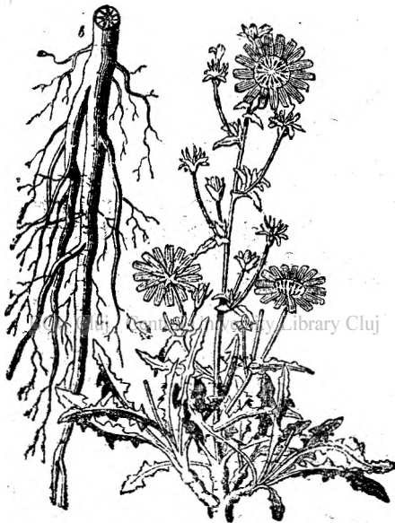
Fig. 7. Cicoarea înflorită și rădăcina ei.

la noi. Se găsește peste tot locul în pășune și în fânețe, precum și pe locuri necultivate. Are flori albastre și o rădăcină de grosimea degetului. Foile uscate se întrebuintează în ceai, drept curățenie ușoară, înlesnind eșirea afară. Dar cicoarea aceasta o pomenim aici mai mult pentru rădăcina ei; uscată în bune condițiuni