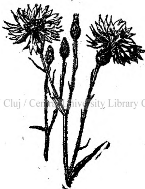
Fig. 9. Țintaură.

Țintaura este foarte amară. Are proprietăți: întăritoare, dă poftă de mâncare, ajută mîstuirea, se dă contra frigurilor ca ajutor al chininei. Se întrebuițează ca ceaiu; se face o tinc-