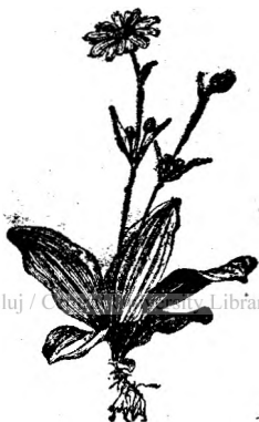
Fig. 5. Arnica.

9 Arnica se găsește prin fânețele din păduri de munte ( Arnica montana ). Din această plantă se întrebuințează atât rădăcina cât și foile și florile. Se recoltează de obicei florile și foile. Florile sunt de culoare galbenă. Când sunt uscate produc strănut, prin mirosul pă-