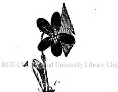
.Fig. 1. Floare de toporăș.

și prin păduri; aceste din urmă au o culoare mai închisă și sunt mai mirositoare. Se culeg numai florile, fără frunze, pe timp uscat. Trebuie pusă multă îngrijire la uscarea acestor flori. Se usucă la un loc umbros, ferit de lumina Soarelui, care le decolorează și perd atunci din valoarea lor. Cu florile de toporăș se face un ceaiu și un sirop contra tusei ușoare. Siropul de toporăș se face cu florile proaspete, dar ca să reușască și în special ca să păstreze culoarea violetă se cer anumite condițiuni și îndemânare.