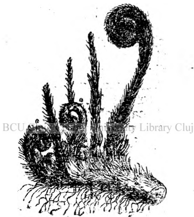
Fig. 13. Tulpina subpământeană de feregă. •

anison ar trebui să înlocuiască obiceiul atât de răspândit la țară și prin orașe în populația mahalalelor de a da copiilor sugaci, când au frământări, neastâmpăr și plâng din cauza colicilor, sirop de căpățâni de mac, mai numit în popor și sirop de roșcove, sau chiar ceai din căpățâni de mac. Acest obicei este foarte primejdios: adese ori aduce moartea. Ceaiul și siropul de mac liniștesc într'adevăr, dar această liniște se produce prin urmele de opiu ce