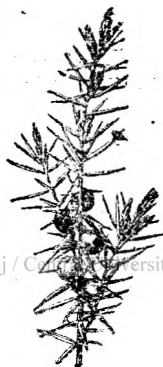
Fig. 14. Iniper.

28. Sămânța de in . Sămânța de in conține o substanță mucilaginoasă și un oleiu. Se ia în-