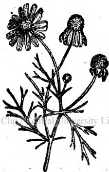
Fig. 3. Mușețelul.

Floarea de mușețel potolește durerile, cărceii de stomac și colicile, înlesnește ieșirea afară, ușurează mistuirea; se întrebuințează și contra frigurilor mai cu seamă amestecată cu pellen. Potolește durerile de măsele, când se ține în gură ceaiul cald de mușețel și se pune pe din afară pe falcă floarea de mușețel călduță