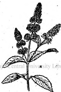
Fig. 10. Flori de mintă.

17. Pojarnița, Sunătoarea. ( Hypericum perforatum ) este o plantă de leac întrebuințată mult în popor. Crește prin fânețe și pe câmpii. Are flori galbii. Se recoltează vârfurile înflorite în luna Iulie. Se întrebuințează sub formă de ceaiu la spălatul rănilor, dar mai cu seamă sub formă de uleiu, care să prepară punând florile în untdelemn sau oloi de floarea-soarelui și lăsând să steie 4—5 ceasuri deasupra unui vas în care se află apă în fierbere. În timpul verei se pun florile proaspete într'un vas de