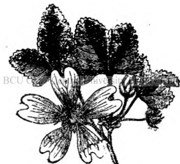
Fig. 8. Nalbă mică.

Aceleași proprietăți le are și Nalba mică ( Malva Sylvestris ) care crește pe câmpii și dela care se recoltează foile și florile. Florile sunt roșietice, iar prin uscare se fac albastre.