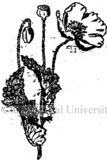
Fig. 4. Flori de mac.

Mușețelul este o plantă de leac, care poate fi recoltată în cantitate mare și vândută la farmacii și droguerii. Trebuie însă uscată în bune condițiuni, așa ca să păstreze pe cât mai mult culoarea și aroma naturală. Este o plantă destul de răspândită la noi pentru ca să fie re-