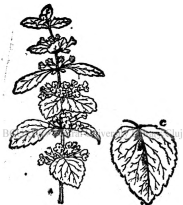
Fig. 11. Foi de melisa.

Tinctura de mentă poate să fie întrebuințată și la durerile de măsele; pentru care să udă vata de pe un bețișor de chibrit, cu tinctura de mentă, se freacă gingia în dreptul măselei dureroase, și apoi o altă vată muiată tot așa, se pune în gaura măselei, schimbându-se din când în când. În lipsă de alt leac poate să fie de folos și în acest caz.