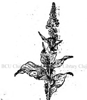
Fig. 12. Lumânărică.

22. Anison să cultivă în grădini. Se întrebuințează fructul numit de obicei sămânță de anison. Este un fruct aromatic, cu gust dul-