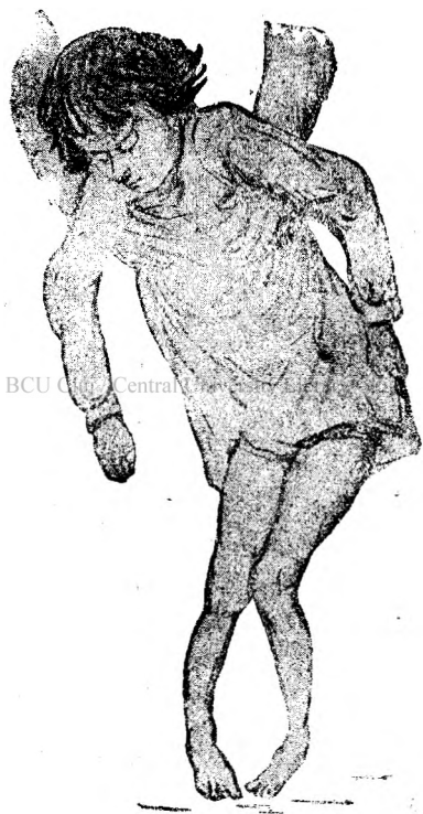
(Fig. 2). Copil de alcoolic.

Căci nebunia și altă boală asemănătoare, paralizia generală sunt datorite alcoolismului și sifilisului. În Franța în 1865 s'a consumat 873.007 hectolitri de spirt și în azile au fost