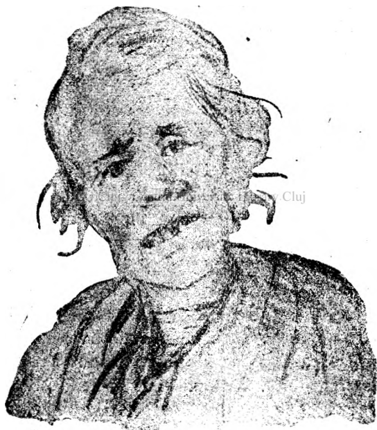
(Fig. 3). Nebună din beție.

Sinuciderile au sporit cu creșterea alcoolismului.