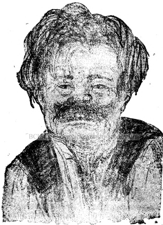
(Fig. 1). Tip de alcolic (delirium tremens).

astfel că alcolicii par gârbovi, îmbătrâniți înainte de vreme, ei nu mai pot lucra nici face copii.