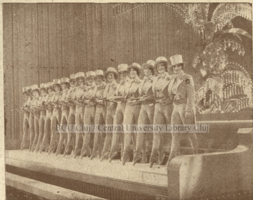
Universal görlik (Filmcentrala Temesvár)

Hihetetlenül hangzik, de tény, hogy a filmszillagok minden pénzüket jövedelmező vállalatokba fektetik. Kevesen hiszik el, de mégis valóság, hogy Mary Pickford bankot vezet szabad óráiban, hogy Bessie Love egy tejvállalat tulajdonosa, hogy Cecil B. de Mille tulajdonát képezi a los-angelesi Biltmore Hotel és ugyancsak az övé Kalifornia legnagyobb garázsa, a Grand Central Garage. Egy másik híres rendezőnek sóaknája van és só-eladással foglalkozik.