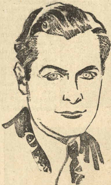
ROBERT MONTGOMERY in "OUR BLUSHING BRIDES"

ához: „A nevető főhadnagy” vilagsikeréhez. Lothar Goldschmiedt német szinpadokon sokszor játszott vigjátéka, a „Csak álom” című képezi a film tárgyát, amelyben Maurice Chevalier egy körülrajongott orvost játszik. A „Királynő férje” óta Chevalier a világ legnépszerűbb filmszínésze. Ez abban is kifejezést nyer, hogy róla készítik a legtöbb karrikaturát a világon.