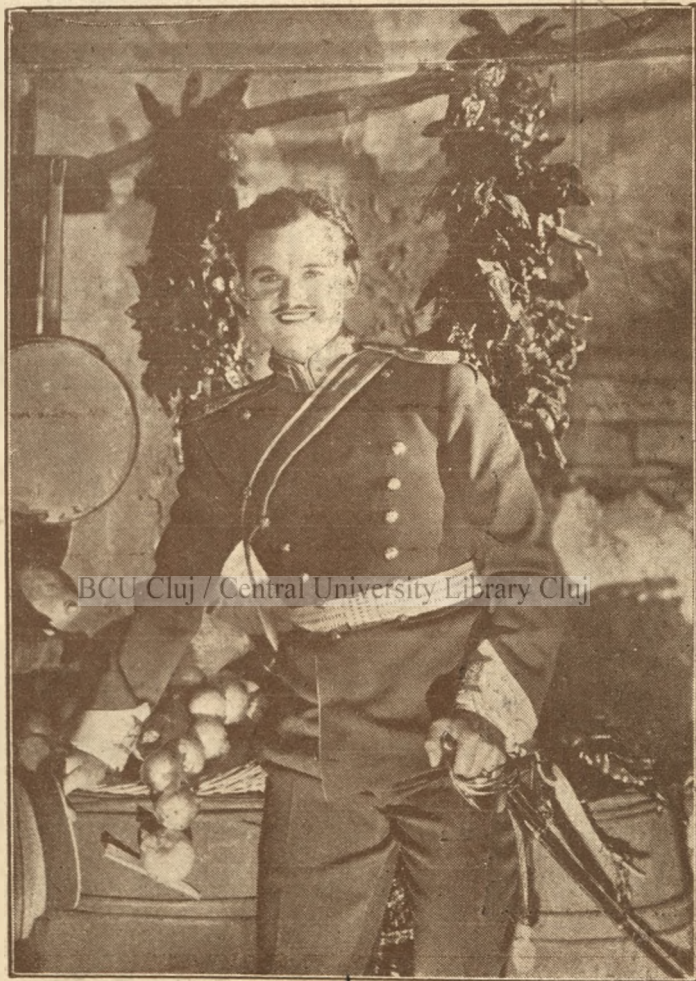
Lawrence Tibett, a világ legjobb baritonisája, akit a „Sasok éneké”-ben ismertünk meg legközelebbi éneklofilmje „A hercegnők hadnagya”

A technikai előkészítés összes izgalmain túl van már, mikor meglehetősen följazott idegekkel, odaszól a főügyelőnek, hogy rendezhetjük. Éles csengőjével a társalgóba, öltözőkbe, a színház