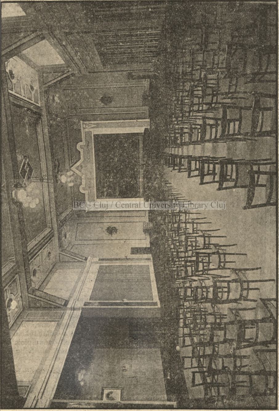
Az arádi Iparos Otthon színháza