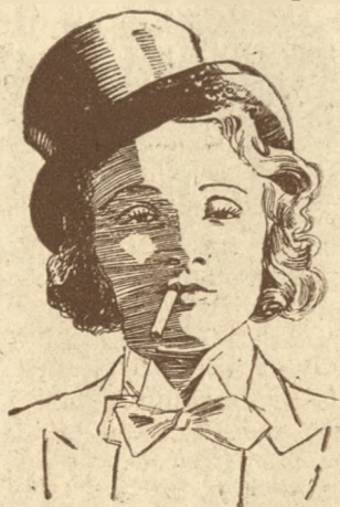
Marlene Dietrich (Paramount)

ban gé helyett giszt fujjon, a kellékes még kicseréli a törni valóvázat, a bonviván még káromkodik egyet, a primadonna a bokáit fászlizza, az egyik kórista még papirból utolsót harap a vajaskenyereből, de már a rendező átment a kishidon, amelyet a színpadot a nézőtérrel összeköti, tapsjelet ad, a karmester pálcájával kopog, a főügyelő fölordit: készen vagyunk! A sugó megnyomja az előfüggöny csöngetyügombját s felharsan az ouvertür a zenekarban. A próba megkezdődik.