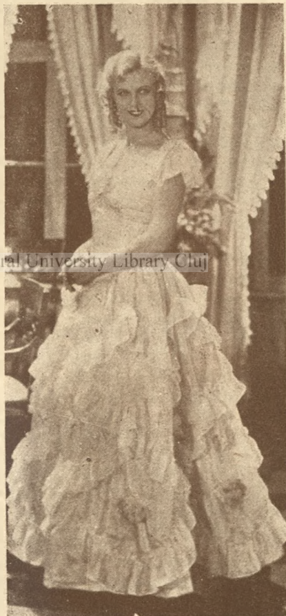
Schubert „Tavaszi felhők az égen“ című képből

A nagy kánikula hatása alatt Cecil B. de Mille, a hírneves rendező érdekes ötletre adta a fejét, miközben fényesen berendezett yachtján pihente ki a filmrendezői tevékenykedéssel járó fáradalmakat. A nagy elfoglaltságu direktor filmrendezés közben időt talált arra, hogy egy érdekes találmányt kieszellen, amely lehetővé teszi, hogy bárki kevés költséggel leszállhasson a tenger fenekére anélkül, hogy a nehézkes buvárruhát magára öltse. Cecil B. de Mille egy sisakot tervezett, melyet a fejére illesztve, bármely ruhához légmentesen odalehet erősíteni. A sisakban a szokott módon két gummicsovön át szivattyuzzák a friss levegőt és máris kész a tengeralatti sétákra alkalmas felszerelés. A rendező és a meghívott társasága már többször szállt le 60 láb mélységre a tenger szine alá, szerinte az ilyen tengeralatti séták a legérdekesebb élményei közé tartoznak.