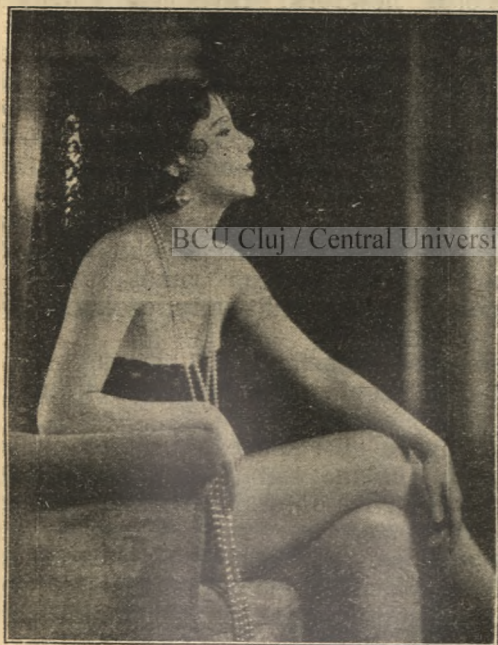
A la Spaniola ...

A newyorki Broadway, amely emberemlékezet óta a legszebb görlicék gyülekezőhelye, most messze elmaradt Hollywood mögött. Nem azért, mintha a Broadwayon megszűnt volna a revü, hanem a hangosfilmfelvételek következtében a görlicék a filmvárosokba verődtek össze. Itt a legtöbb leány állandó foglalkozást kaphat, miután a revürendszerű hangosfilmek iránt az utóbbi időben óriási érdeklődés nyilvánult meg. De ettől eltekintve, minden nevesebb film-atelier nagyszámu görlöt szerződtetett le.