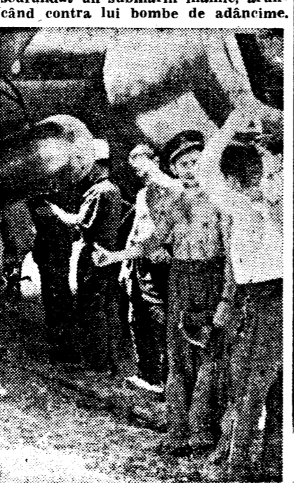
Avion italian pregătit pentru un zbor de război

Generalul american Maxwell a sosit în Egipt NEW-YORK, 23 (Rador). — Corespondentul agenției D. N. B. comunică: Generalul de brigadă Maxwell, din armata Statelor Unite, a sosit Sâmbătă în capitala Egiptului, anunșând Associated Press, spre a lua conducerea delegației americane însărcinate cu livrarea materialului pe care Statele Unite îl trimet forțelor britanice, care luptă în Africa.