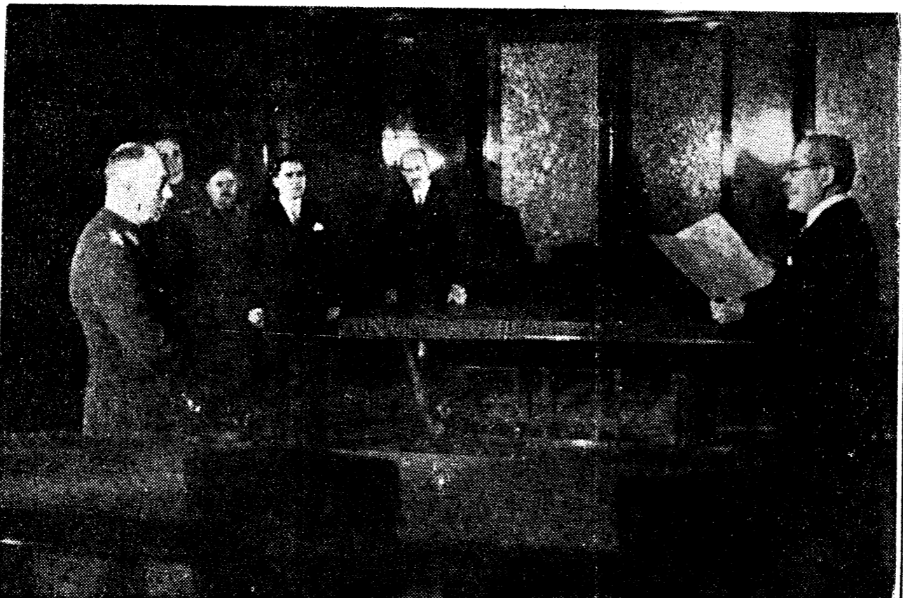
Se citește procesul verbal al Comisiei Centrale

„Nu“ 68 (șasezeci și opt). Total voturi exprimate: 3.446.957 sau un procent de 99,998% „Da“ și un procent de 0,002% „Nu“. In calculul de mai sus intră și voturile exprimate de românii din Regat aflați în Transnistria cum și de personalul Legațiunilor Țării în străinătate. Se menționează că asupra increderei ca Mareșalul Antonescu să procedeze la reforma națională a Statului și la apărarea drepturilor Neamului s'au abținut de a vota în acest sens un număr de 36 votanți, cari însă și-au dat votul pentru aprobarea guvernării Mareșalului Antonescu dela 6 Septembrie 1940, rămânând dar un total de 3.446.853 voturi. Drept care s'a încheiat azi 22 Noiembrie 1941 în Palatul Ministerului de Justiție din București prezentul proces-verbal în 2 (două) exemplare, din care unul se va înmâna Conducătorului Statului, iar cel de al doilea Domnului Ministru al Justiției, spre a fi păstrat în arhivele Ministerului.