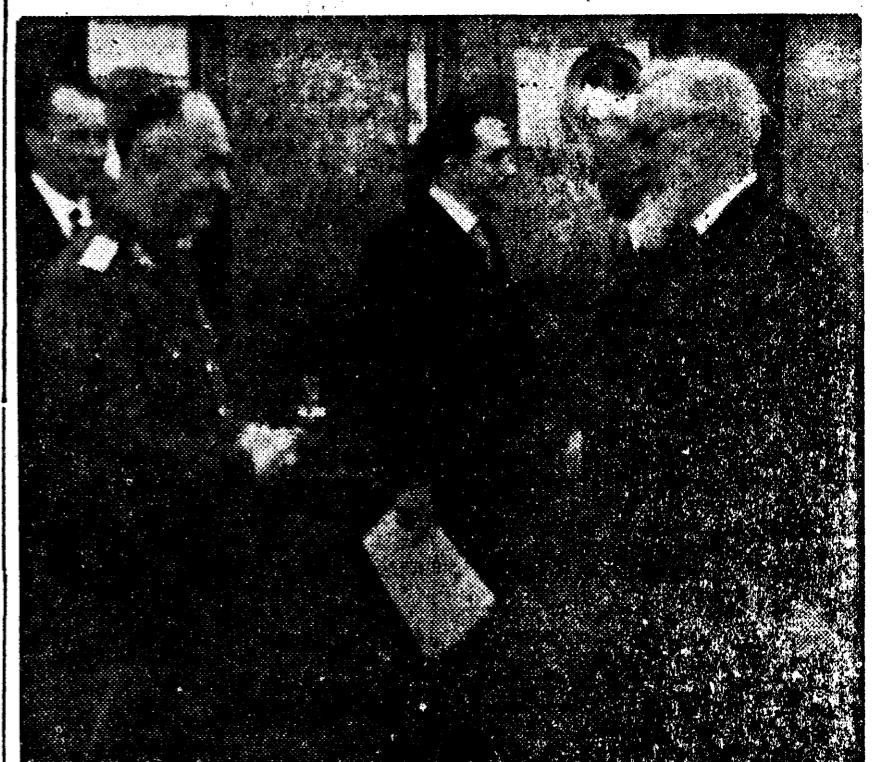
D-nii mareșal Antonescu și prof. Mihai Antonescu se întrețin cu membrii Comisiei plebiscitare