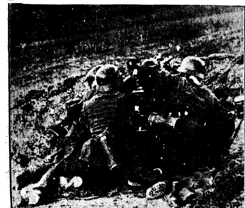
Un cuib german de mitralieră pe frontul de Vest

Panca a fost întreținută de fratele și de văru ei, cu ajutorul cărora a reușit să termine cursurile școlii comerciale din localitate.