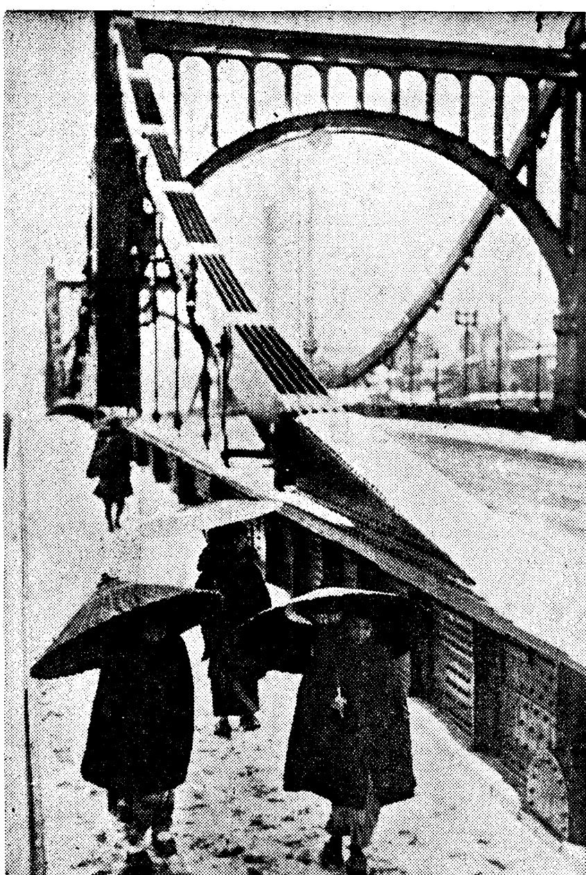
Micilor chinezoice nu le place zăpada, — totuși sunt forțate să circule pe străzi