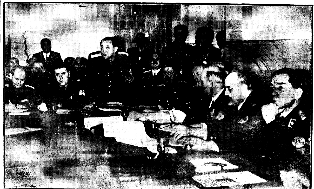
D. consilier regal Gh. Tătărescu, președintele Consiliului și membrii guvernului în timpul conferinței gospodărești, care a avut loc Sâmbătă în capitala Basarabiei

Regele-Împărat a primit în audiență privată pe generalul de divizie Henri Parisot, atașat militar pe lângă ambasada Franței din Roma.