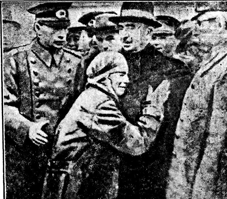
O femeie care și-a pierdut copiii și averea în catastrofa din Anatalia, plânge cerând parca ocrotire d-lui Ismet Inonu, președintele Republicii Turce, care o consolează. La stânga, în uniformă, generalul Orbay, comandantul armatei turce

Este de așteptat o mare accelerare în schimbul de mărfuri. Astfel, în primele zece zile ale lunii Ianuarie, numărul trenurilor de transport sosit din Rusia a atins aceiași cifră ca în luna Decembrie întregă.