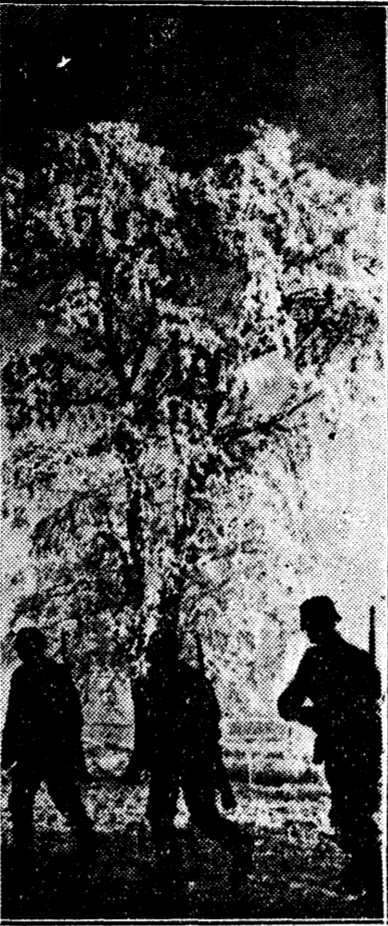
Noaptea pe frontul de Vest, soldați germani în patrulă