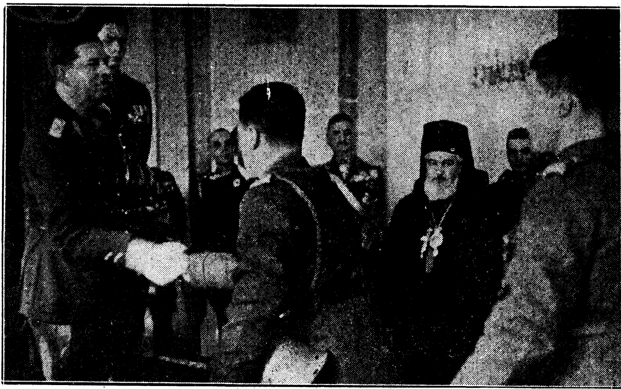
Suveranul dând mâna cu ostașii unităților ce fac de strajă la Nistru

Intonat de diaconi și de ierarhi, — imnul acesta dobândește astăzi o mistică rezonanță: Regele apărător de țară și de credință a svârșit în apă alba cruce de chiparos, adusă de Sfântul Munte, — și din nou crește nimb de atlet al Creștinătății în jurul Domnului dăruit cu moștenirea Sucevei. Regele României Mari a svârșit în apa sfințită crucea Mântuirii, a sârutat apoi smerit Iemul Răstignirii, și norodul ivit din cătanele Basarabiei a înțeles că acolo unde este straja hotarnică este și chezașia ocrotirii altarelor străbune.