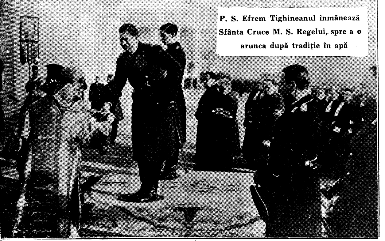
P. S. Eftrem Tighineanu îmbrănează Sfânta Cruce M. S. Regelui, spre a o arunca după tradiție în apă

Ecourile departate ale clopotelor planează peste marșalele acorduri ale fanfarei de întâmpinare: Suveranul a vorbit zămbitor cu demnitate prezenti, — câteva minute, — și surădul de mulțumire li sporște deodată, când răsărind în fața mulțimii Se vede salutul de fremitice urale, de aclamații ce se tăl-