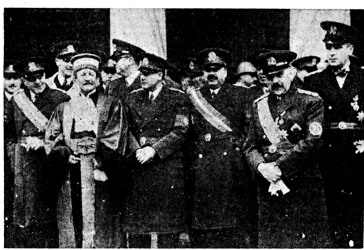
Membrii guvernului după slujba dela Patriarhie