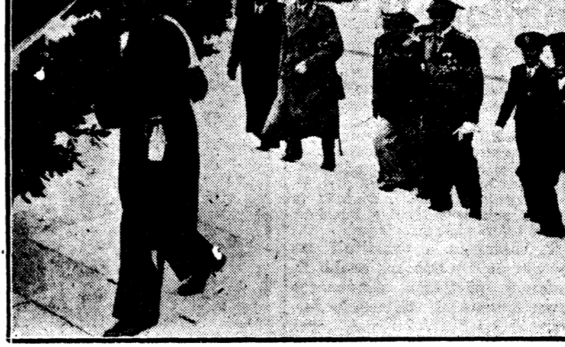
Ministrul României la Roma depune o coroană pe mormântul Eroului Necunoscut, dela Capitoliu