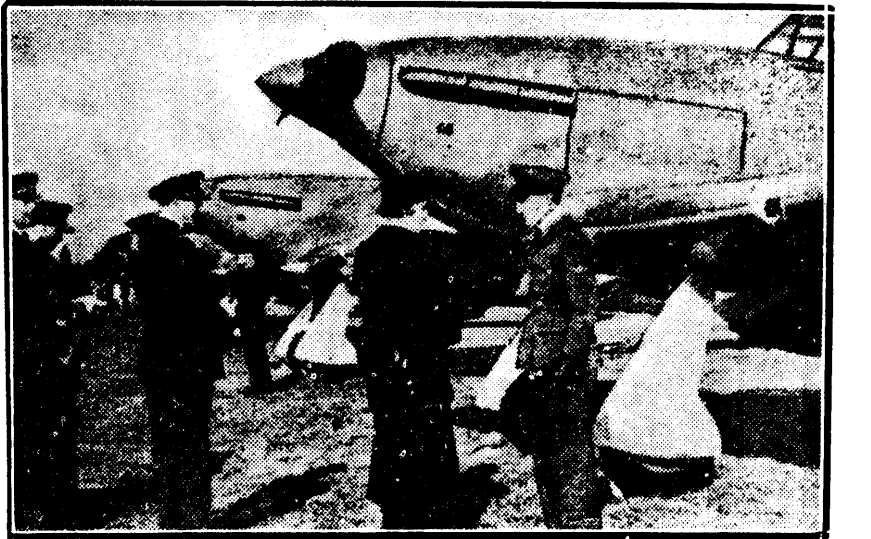
Regina mamă Elisabeth a Belgiei vizitează un centru de aviație, ascultând cu atenție lămuririle unui ofițer