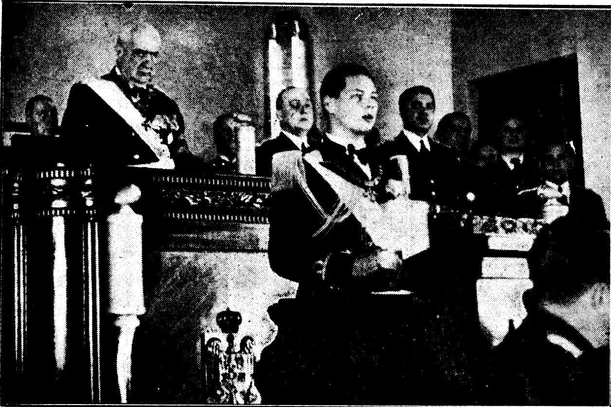
Principele Moștenitor pronunțând discursul

Marele Voevod Mihai proclamat senator de drept. Proslăvirea zilei de 25 Noiembrie 1914