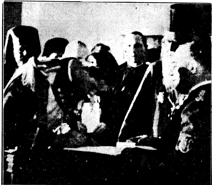
Marele Voevod Mihai iscălinind actul de jurământ

duce la alte înfăptuiri ce vor face mândria generațiilor viitoare. Rugăm respectuos pe Măria Ta să vie cât de des în mijlocul nostru și să plece urechea la toate nevoile, la toate necazurile, la toate suferințele ce-și fac drum până în această incintă prin glasul reprezentanților cei mai calificați ai