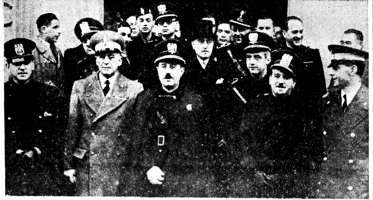
Ducele di Capece-Regina însărcinat cu afaceri al Italiei, în mijlocul membrilor legației, la ieșirea din biserica italiană