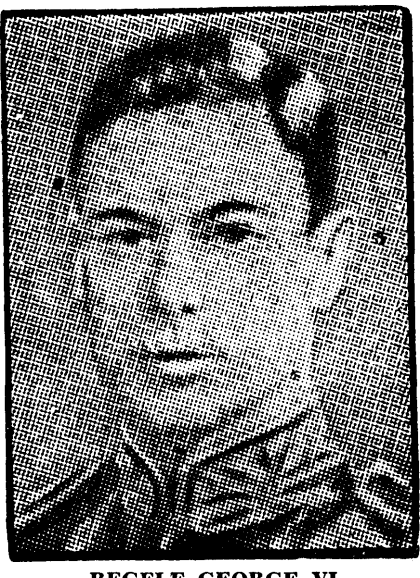
REGELE GEORGE VI

4. — Guvernele mele apreciază profund spiritul care însușește propunerea M. V. și a fi totdeauna dispuse să examineze bazele rașionale și sigure ale unei păci echitabile. Acesta este și a fost totdeauna dorința mea ca războiul să nu dureze nici cu o zi mai mult decât este absolut necesar, și pot prin urmare să răspund imediat unei părți din apelul M. V., în care se declară dornic să înlesnească căutarea elementelor unui eventual acord. 5. — Condițiile esențiale pe care