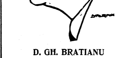
D. GH. BRĂTIANU

Despre guvernarea actuală Sfârșitul cărmuirii nu cum-va ni-l vestește aducerea apropiată a legii responsabilității miniștrilor și care trebuie trecută în ultima zi a guvernării pentru a acoperi pe cele ce au fost? Prietenii noștri se plângeau de furturile ce s'au săvârșit din programul nostru. Știm însă că s'au furat lucruri mult mai concrete decât programuri și lozinci. De aceea cei cari vorbesc de responsabilitatea ministerială, să înceapă prin a și-o aplica lor înșiși. Un alt indiciu în gazetele locale și fie în Capitală au început să fie inserate tot felul de svonuri și să fie înregistrate fel de fel de vizite. Eu țin să spun de aici, în aceste vizite cari se cer și se primesc, noi nu avem nici un amestec, căci noi nu facem opoziție vizitelor și nici a tranzațiilor. S'a spus că am vrea să ridicăm în parlament chestiunea recentă; înlocuiri; din guvernul Tătărăscu. Pot s'o afirm că pe noi nu ne preocupă dacă guvernul este mai omogen cu Irimescu decât cu d. Caranfil. Pe noi ne preocupă altceva. Avem un minister al aviației și al marinei, avem un timbru al aviației și poate vom mai avea și unul al marinei. Voi pune o singură întrebare: avem însă aviație? avem marină?