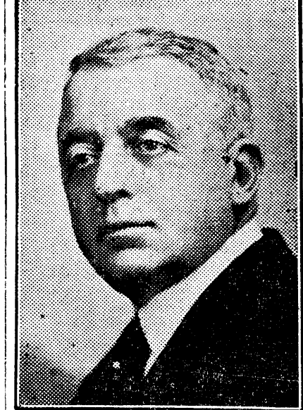
D. VICTOR ANTONESCU

ale Camerii și Senatului.” „Le Matin” adaugă că această colaborare nu va avea decât efecte fericite pentru menținerea păcii în Europa Centrală și în Europa Orientală. „L'Europe Nouvelle” consacră d-lui Victor Antonescu următoarea notă, deosebit de elogiasă: „Venind la Paris, d. Victor Antonescu vine în cea de a doua a sa patrie. Urmașul d-lui Titulescu evoca drept cea mai frumoasă zi a carierei sale ziua de 11 Octombrie 1919. Este ziua când, însărcinat cu o importantă misiune de guvernul francez, d. Victor Antonescu a plecat dela Salonic pe bordul unui avion francez. Colaborator la victorie, d. Antonescu este astăzi unul din marii lucrători pentru cauza păcii. De la venirea sa în fruntea ministerului afacerilor străine al României, d. Victor Antonescu a îndeplinit o acțiune considerabilă. Nu s'a uitat călătoria sa la Praga, — unde a însoțit pe M. S. Regele Carol II, în