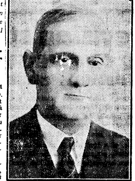
D. D. IUCA

se poate să nu aibă aprobarea noastră a tuturor. Trebuie ca toți cei care temporar conduc destinele orașului Giurgiu și a județului Vla-