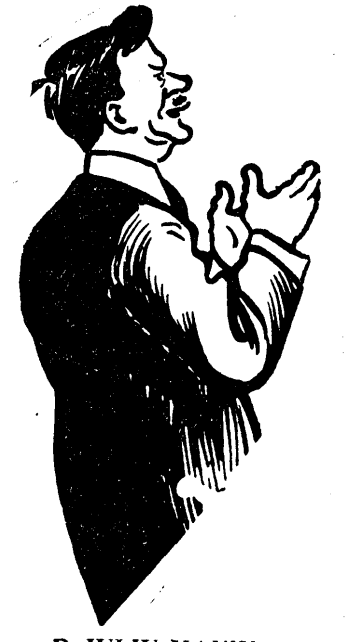
D. IULIU MANIU

Dacă cineva mai are vreo iluzie după scoaterea lui Titulescu, se înșală. La 14 Septembrie l-am văzut pe Titulescu pe patul de moarte. Din buchetul de mărați, niș, el a fost rupt și călcat în picioare, singurul trandafir. Au dat vreo explicație pentru ce l-au scos?