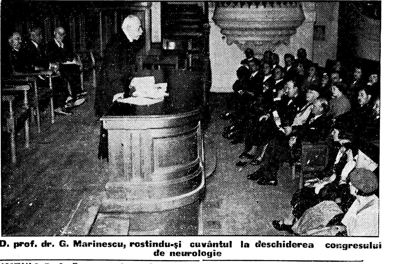
D. prof. dr. G. Marinescu, rostindu-și cuvântul la deschiderea congresului de neurologie