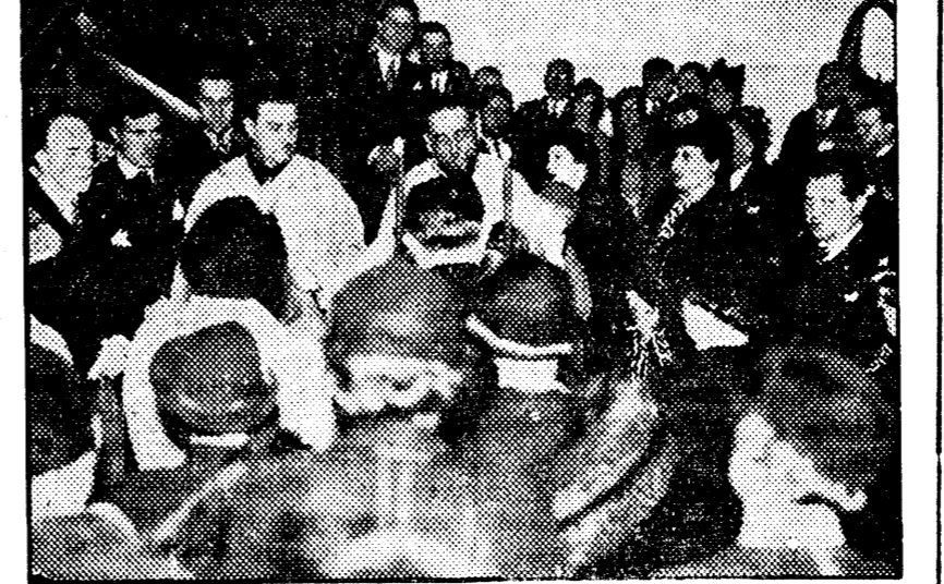
Serviciul divin în inaugurarea cursurilor Conservatorului „Pro-Arte”