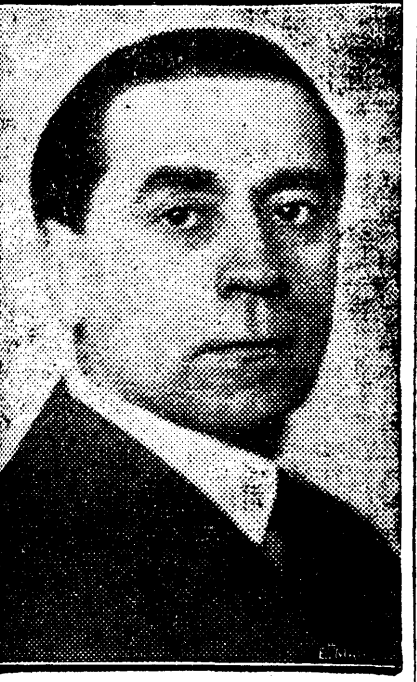
D. Gh. Tătărescu

In vederea inaugurării sanatoriului de tuberculoși din Dobrița (Gorj), a noulor secțiuni ale spitalului local, a dispensarilor din județ, a căminu-