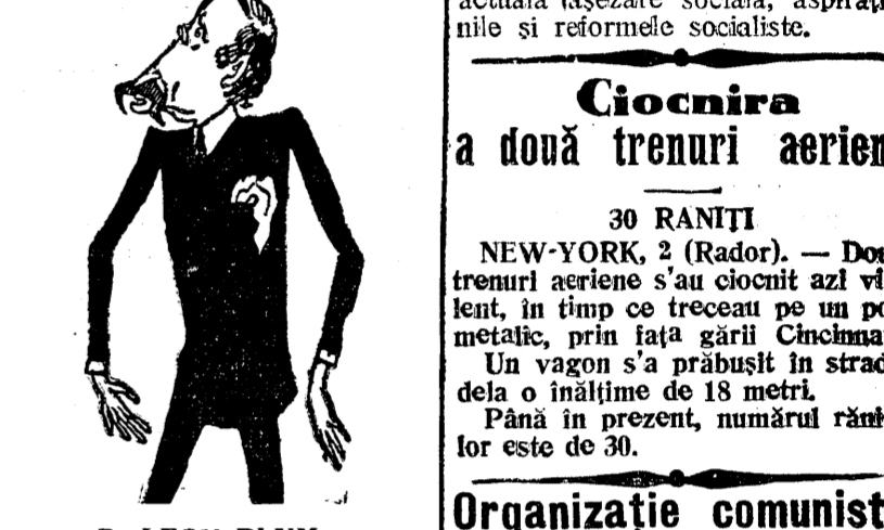
D. LEON BLUM

Intrevederea a durat dela ora 16 și până la ora 17,25, când ambii oameni de stat au părăsit împreună Quai d'Orsay-ul, ducându-se la reședința M. S. Regelui Carol, unde Suveranul român urma să primească la ora 17,30 pe d. Flandin. Nici d. Titulescu, nici d. Flandin nu au făcut declarații presii.