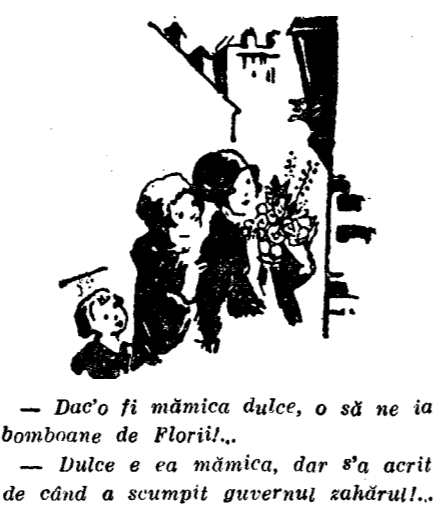
Dacă o fi mămică dulce, o să ne ia bomboane de Florii...

ce scăderea prestigiului lor, în ochii populației. Consiliul general al Asociației face apel ca toți învățătorii, cari au atins un anumit număr de ani, spre a putea avea la pensie, și-și ceară pensionarea, spre a face loc învățătorilor tineri. Polonia În Polonia bugetul Ministerului Instrucțiunii Publice, pe anul în curs, se prezintă cu o reducere de 4 la sută, atâncând cifra de 3311.183.530 zloți (aproximativ 6 miliarde). Numărul școliarilor însc.și este de 4.362.000 elevi, dintre cari 458.000 nu pot fi primiiți în școli, din lipsă de învățători. Asociația generală a învățătorilor polonezi în ședința dela 17 Dec. 1933 a protestat contra faptului că, în ce privește salarizarea, funcționarii inferiori și mijlocii au suferit amputarea salariilor, în vreme ce salariile funcționarilor superiori au fost mărite. Pe de altă parte Asociația trage atenția guvernului asupra situației penibile a învățătorilor începători, cari au un salariu derizoriu, 130 zloți lunar (2500 lei lunar). Asociația învățătorilor polonezi editează următoarele reviste periodice: Munca școlară; Instrucțiunea poloneză post școlară; Școala specială; Arhiva poloneză de psihologie; Desemul și lucrările practice în școală; Mișcarea pedagogică; Școala profesională complementară; Educația fizică în școală; Cântul în școală; Școlile cu un singur învățător; Școala de copii mici; și ziarul Glasul învățătorilor.