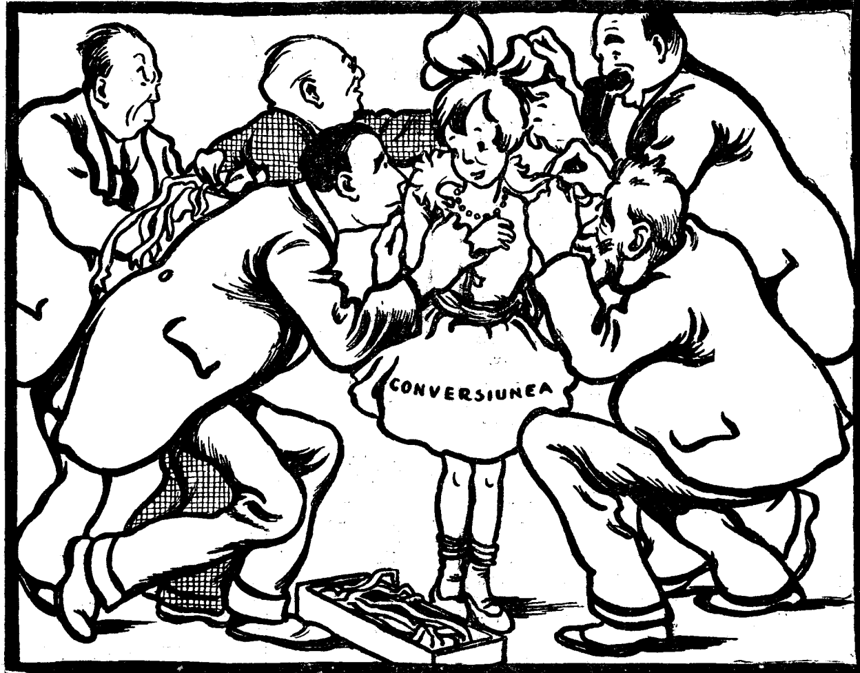
— Mai pune-i o cordeluță... — Să-i prindem și o funduliță... — Când o eși de Paști la horă, să crape toate... partidele!