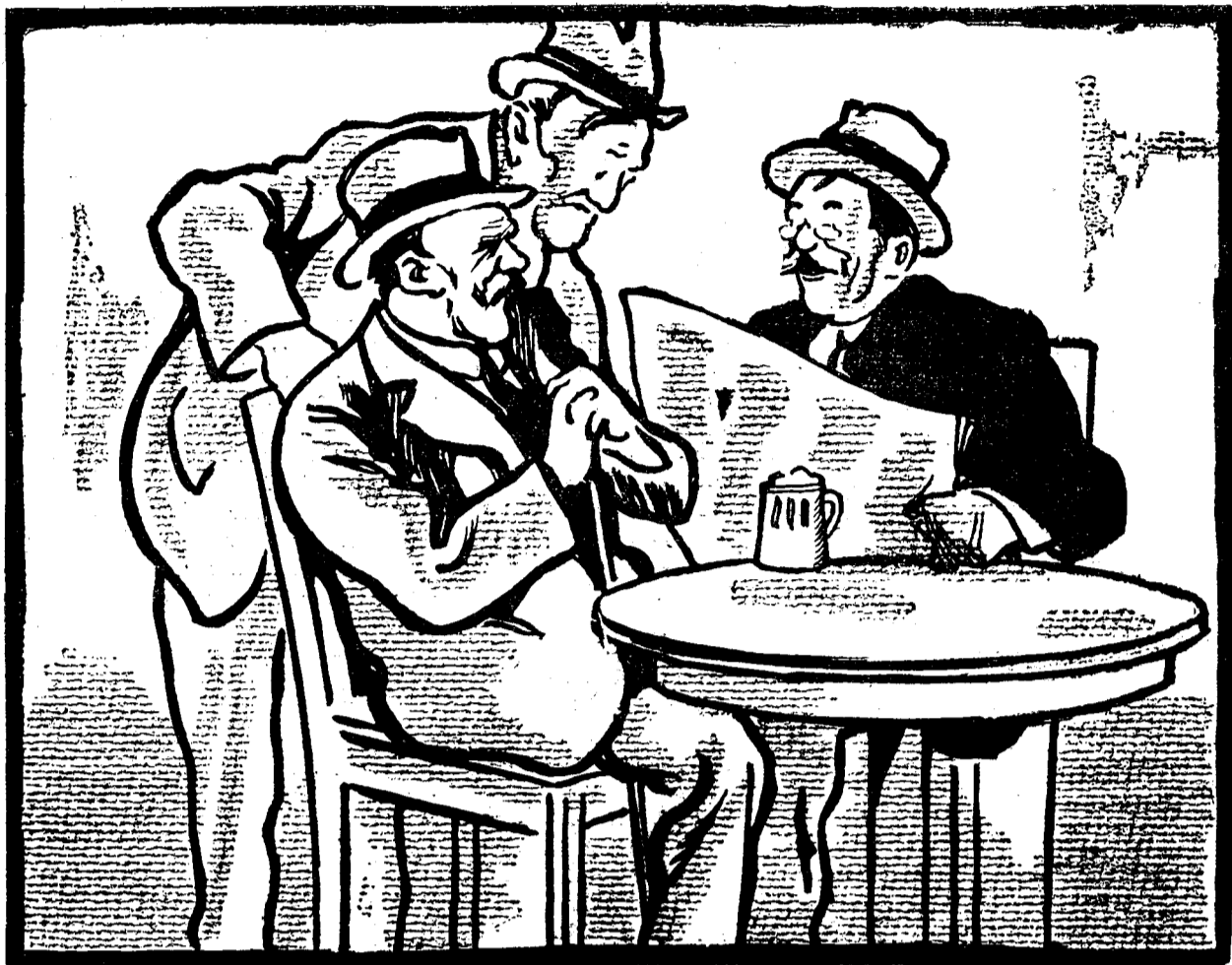
— Cred că Parlamentul o să se închidă peste câteva zile... — Ce te face să crezi asta? — Au început să se depună câte două-două zuzini de legi pe zi!