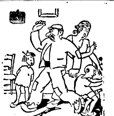
Fi-mi-ar blestemată soarta, c'am ajuns acum să mi se amestece toți vecinii în treburi, de par'căș fi căzut în hațul lui Otto de Habsburg!