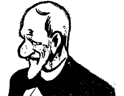
D. MAREȘAL AVERESCU