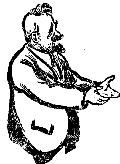
D. DINU BRĂȚIANU

În tot cursul ultimelor două zile au continuat concitațiile în vederea alegerii noului șef al partidului liberal.